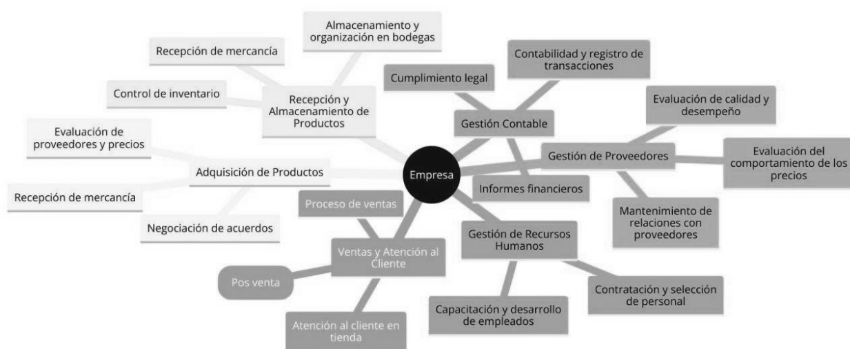
Mapa de procesos de Ferretería La Nueva

Nota. Mapa de procesos de Ferretería La Nueva. Elaboración propia.