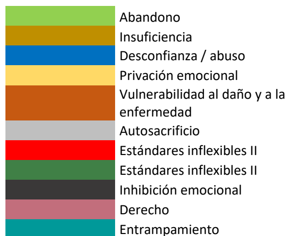
Figura 1. Se relaciona la presencia de los EMT de la población.

Según el análisis de datos obtenido en el instrumento de valoración del riesgo para la vida y la integridad personal por violencias de género en el interior de la familia, se obtiene que 13 estudiantes presentan un indicador de riesgo alto. A continuación, se relacionan los esquemas maladaptativos