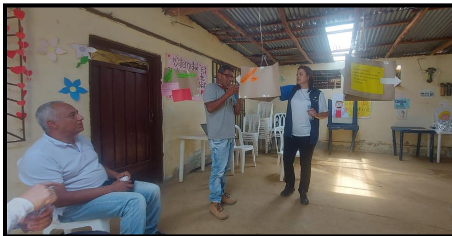
Imagen 3. Equipo investigador proyecto de investigación C123-520-513. Capacitación líderes sobre las fases del POT.