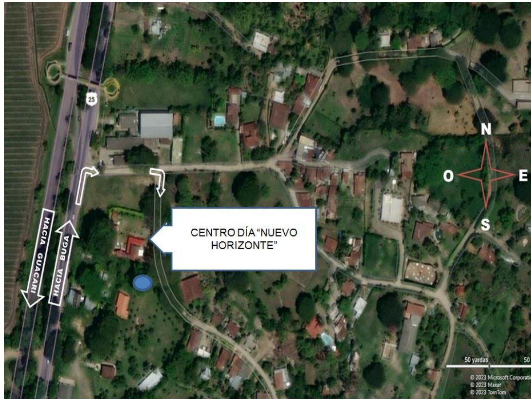
Google maps,2019, fotografía

El Centro Día Nuevo Horizonte funciona en una casa campestre que cuenta con amplias zonas verdes a la que se ingresa a través de estrictos controles que tienen como fin garantizar la seguridad de los funcionarios y usuarios de las instalaciones. La portería tiene un acceso vehicular y otro peatonal. Además, cuenta con una cerca viva que restringe la vista hacia el interior. Al ingresar, sobre el costado derecho, hay un kiosco que hace ver las instalaciones como si fuesen un centro recreativo, ya que está dotado con sillas y una cocineta. Más adelante, puede verse una pequeña zona verde en la que hay bancas de concreto, árboles y mesas, muy similar a un parque en el que las personas pueden conversar, tomar aire fresco y disfrutar de la sombra y de los sonidos de la naturaleza.