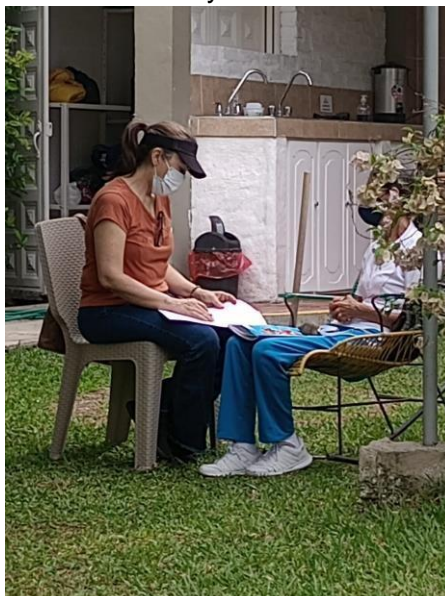
Ilustración. Entrevista voluntaria adulto mayor 2

Resulta necesario mencionar que, en contraste con otro tipo de centros de atención para adultos mayores, en especial los que están vinculados con la beneficencia y que reciben el nombre de asilos, estos no son del agrado de los usuarios del Centro Día, sobre todo porque generan separación de los y las adultas mayores con sus familias, de ahí que la estrategia de los Centros Día a nivel nacional contribuye a la conservación de las relaciones sociales y familiares de los y las usuarias, hecho que disminuye la probabilidad de abandono del adulto mayor.