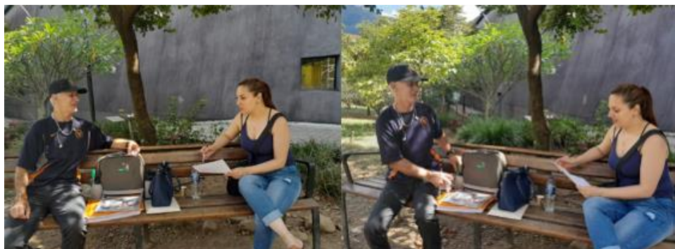
Primer acercamiento con una de las víctimas que cumple con los criterios de inclusión de la investigación.