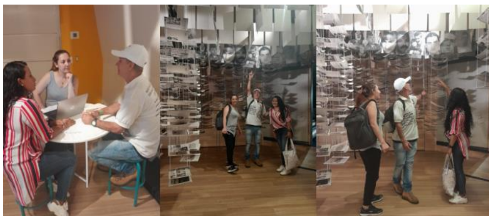
Entrevista, a una de las familiares víctimas del fenómeno social (Trabajo de campo)