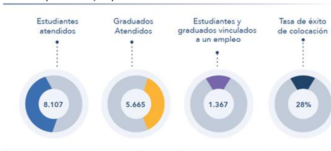
Figura 1: Logros en empleabilidad y emprendimiento.

Logros de en empleabilidad y emprendimiento 2017 -2019