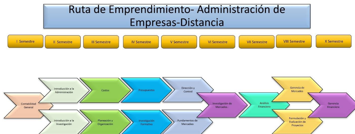
Figura 3. Ruta de emprendimiento del programa.

Ruta de emprendimiento del programa distancia