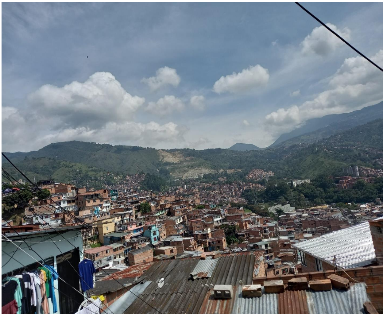
Imagen de la panorámica de la Comuna 13. Donde se visualiza una parte del barrio