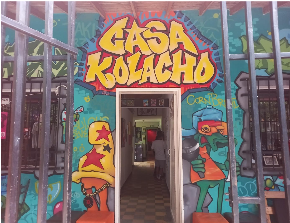
Imagen de la fachada Casa Kolacho, donde se practican las diferentes expresiones artístico-cultural, como: el Hip Hop, el Grafiti y el Rap.