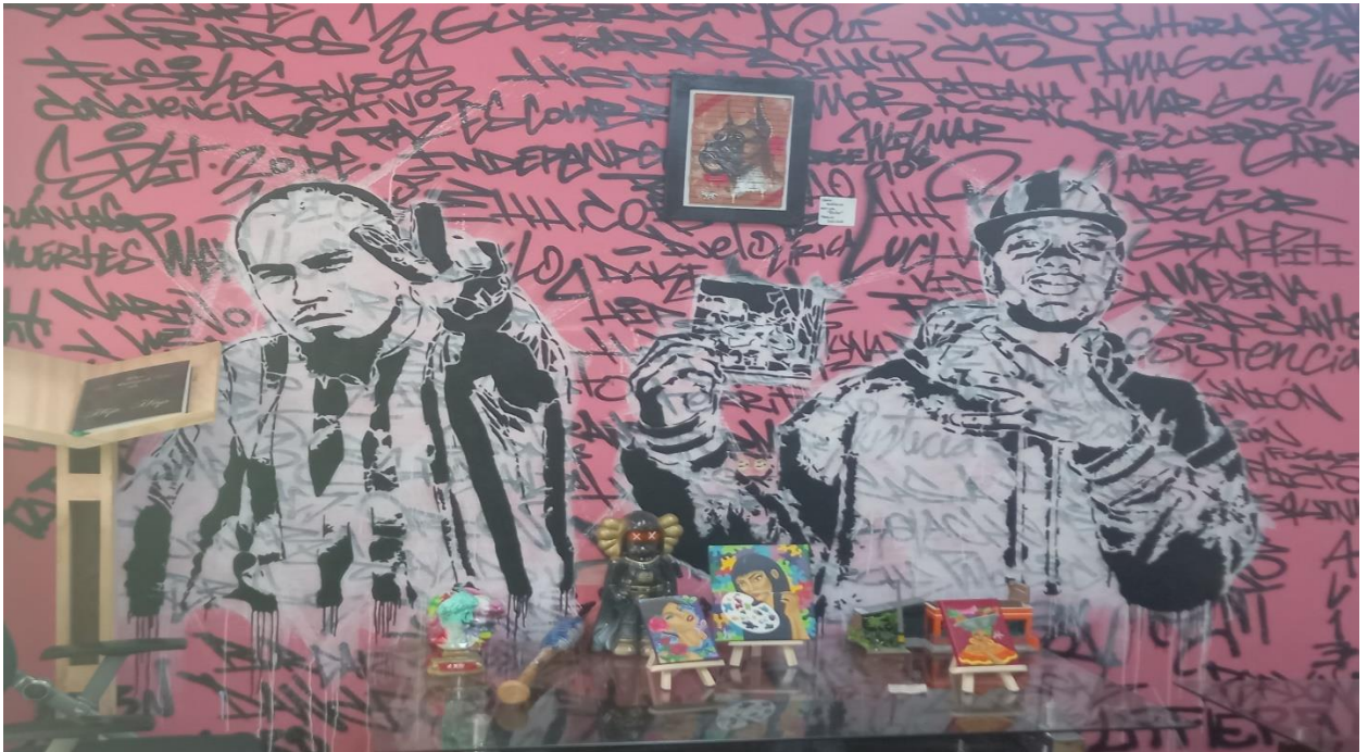
Grafiti de las diferentes expresiones artísticas y culturales de la Comuna 13.