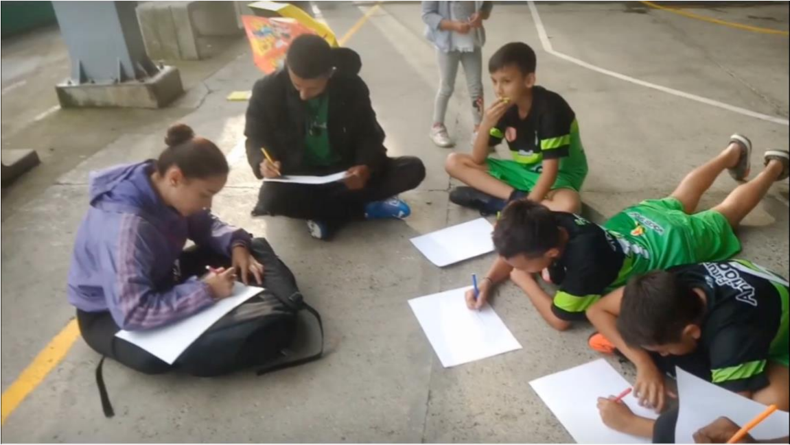
Anexo 5. Archivo fotográfico Diarios de campo.