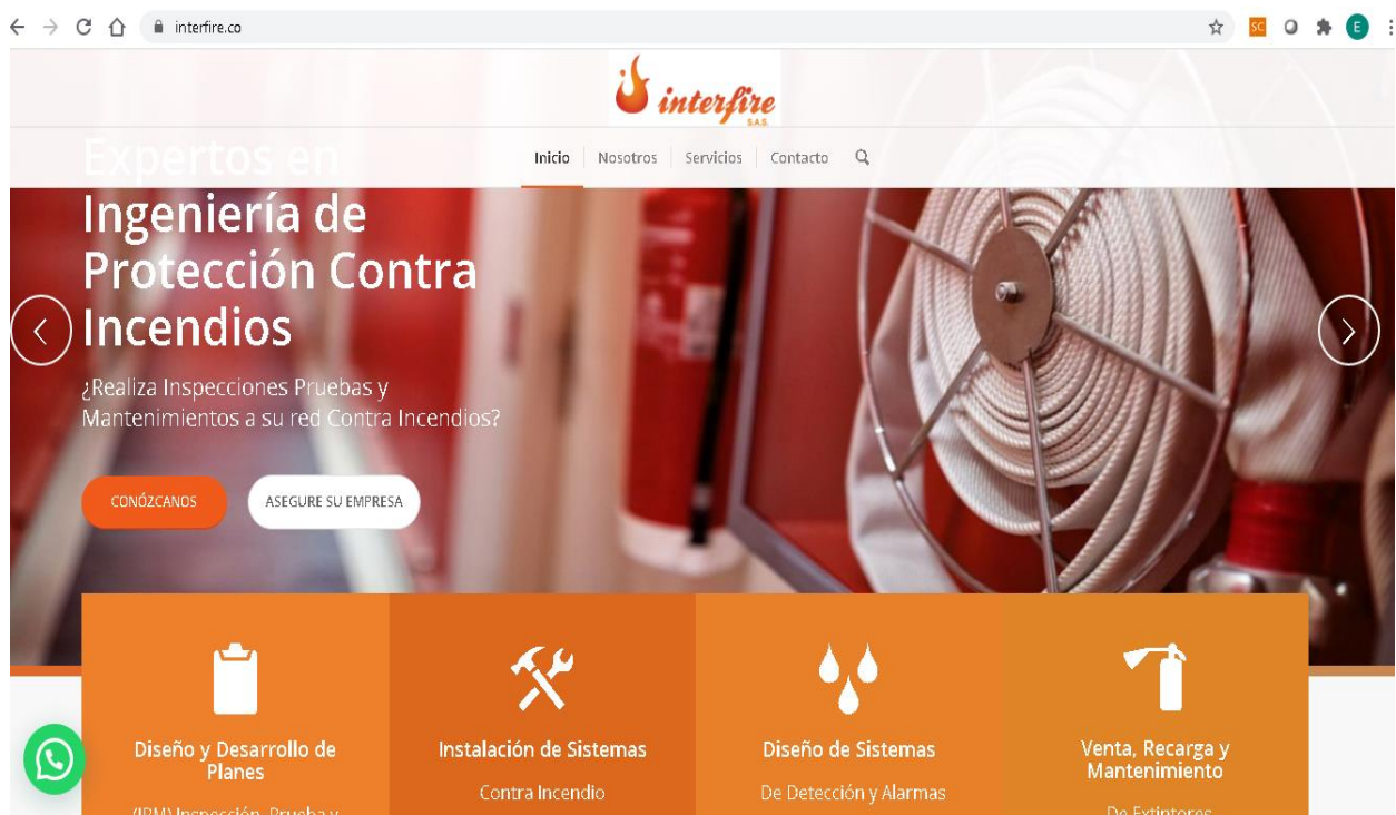
Figura 4. Página web de la empresa para incluir PESV.

Para la visualización del plan estratégico de seguridad vial se propone ofertarlo en la página web de la empresa (figura 4) junto con los procesos misionales, en el enlace de inicio y será puesto como un valor añadido para la compañía y las empresas que contratan sus servicios.