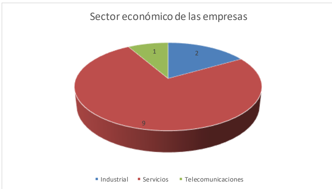
Figura 1. Sector económico de las empresas encuestadas

Se aplicó una encuesta a 12 empresas distribuidas entre almacenes de cadena, empresas de servicios de telecomunicaciones, edificios, centros comerciales y empresas de producción, estas pertenecen al sector de servicios y producción (figura 1)