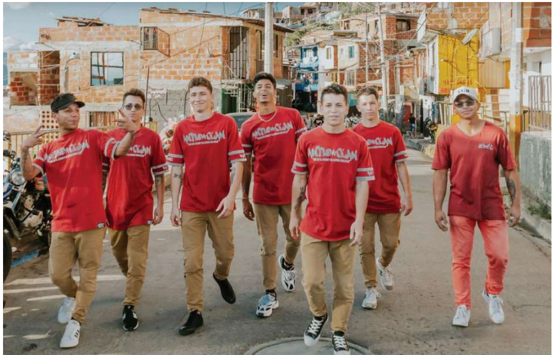
Figura 1: Integrantes de Nativos Latin Crew.