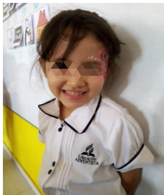
Ilustración 3 Evidencia de observación