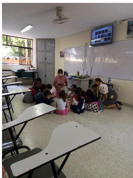
Ilustración 4 Evidencia, aplicación de la sesión 1

En la sesión uno, se inició recalcando el momento cuando el rey le ofrece a Abraham los tesoros que recuperaron como pago por salvar al pueblo, pero este no acepta ya que lo hizo por amor a su sobrino Lot. Teniendo en cuenta esto se les plantearon ciertos dilemas morales a los estudiantes, sobre ¿cómo se sentirían ellos si estuvieran pasando por la situación de Lot? La respuesta del grupo se resume en dos palabras: miedo y tristeza. Los estudiantes se mostraron interesados en compartir su forma de pensar frente a la problemática, relacionando la situación de Lot con la vida de los migrantes del país, mostrando empatía por y reconociendo que en ocasiones les han ayudado con sus familias. Se les facilita una lista de chequeo donde podían encontrar acciones de servicio en el hogar o en la comunidad. La siguiente clase conversarían sobre qué actividades pudieron hacer y cuáles no. Para finalizar realizaron una manualidad donde dibujarían como se sentirían si pasaran por la situación de Lot y como se sentirían si fueran rescatados.