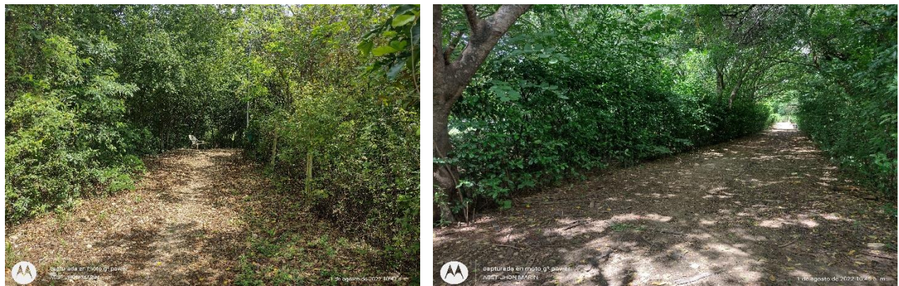
Figura 11: vía de ingreso y salida de móvil 3 puentes de madera, lote B9, casa 94