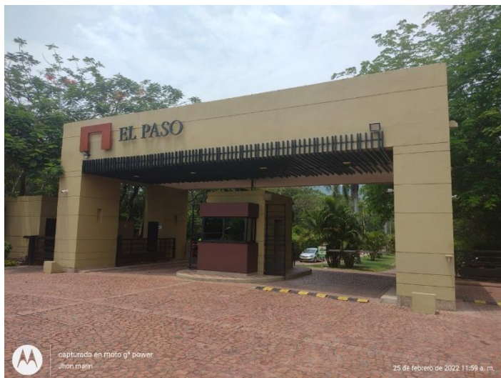
Figura 1. Figura 1 Condominio hacienda el paso Tocaima.