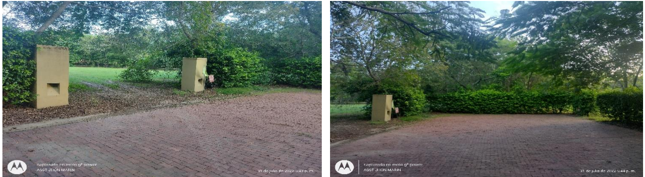
Vía de ingreso y salida a la malla perimetral por el lote 1

Nota: vía de ingreso y salida a la malla perimetral de zorgal, es ruta de salida desde el punto 2 hasta la salida vía vehicular (Via de ingreso y salida).