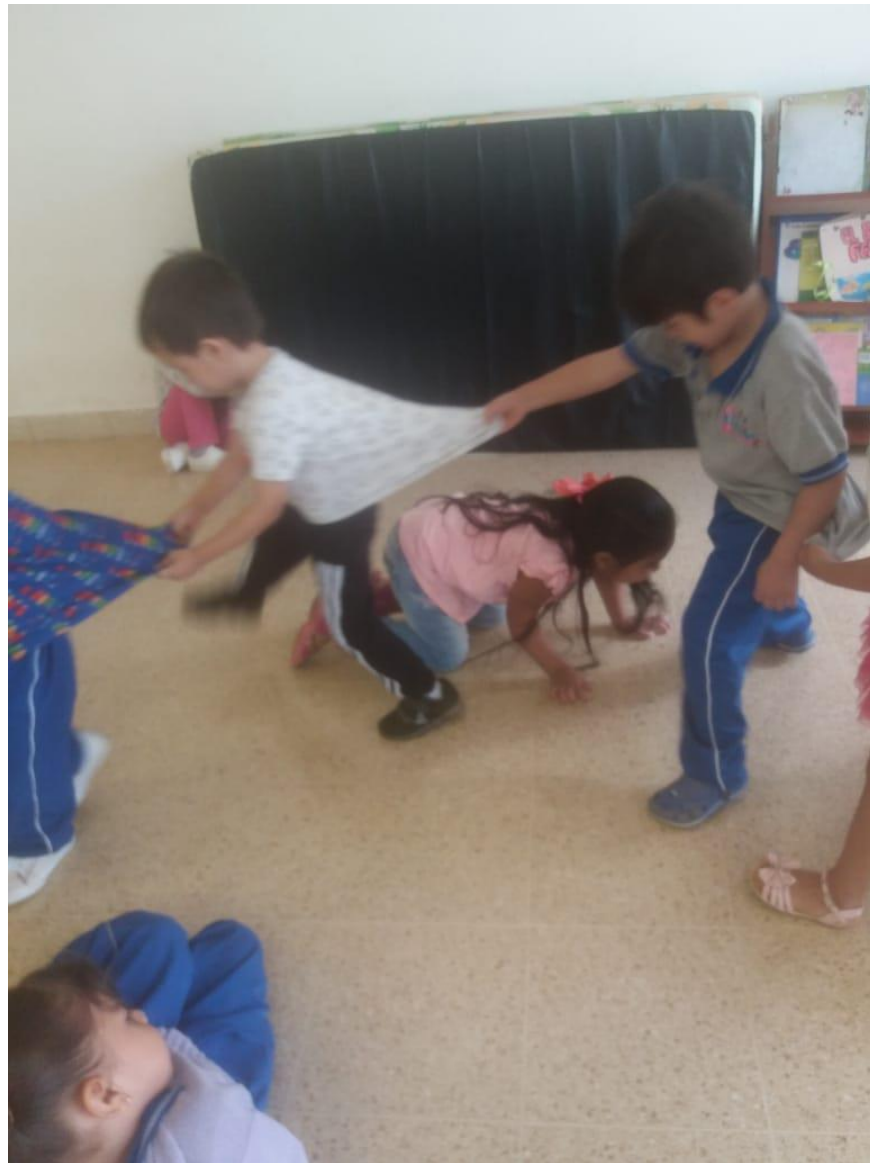
Fuente: taller con los niños y las niñas 27 de febrero de 2020.