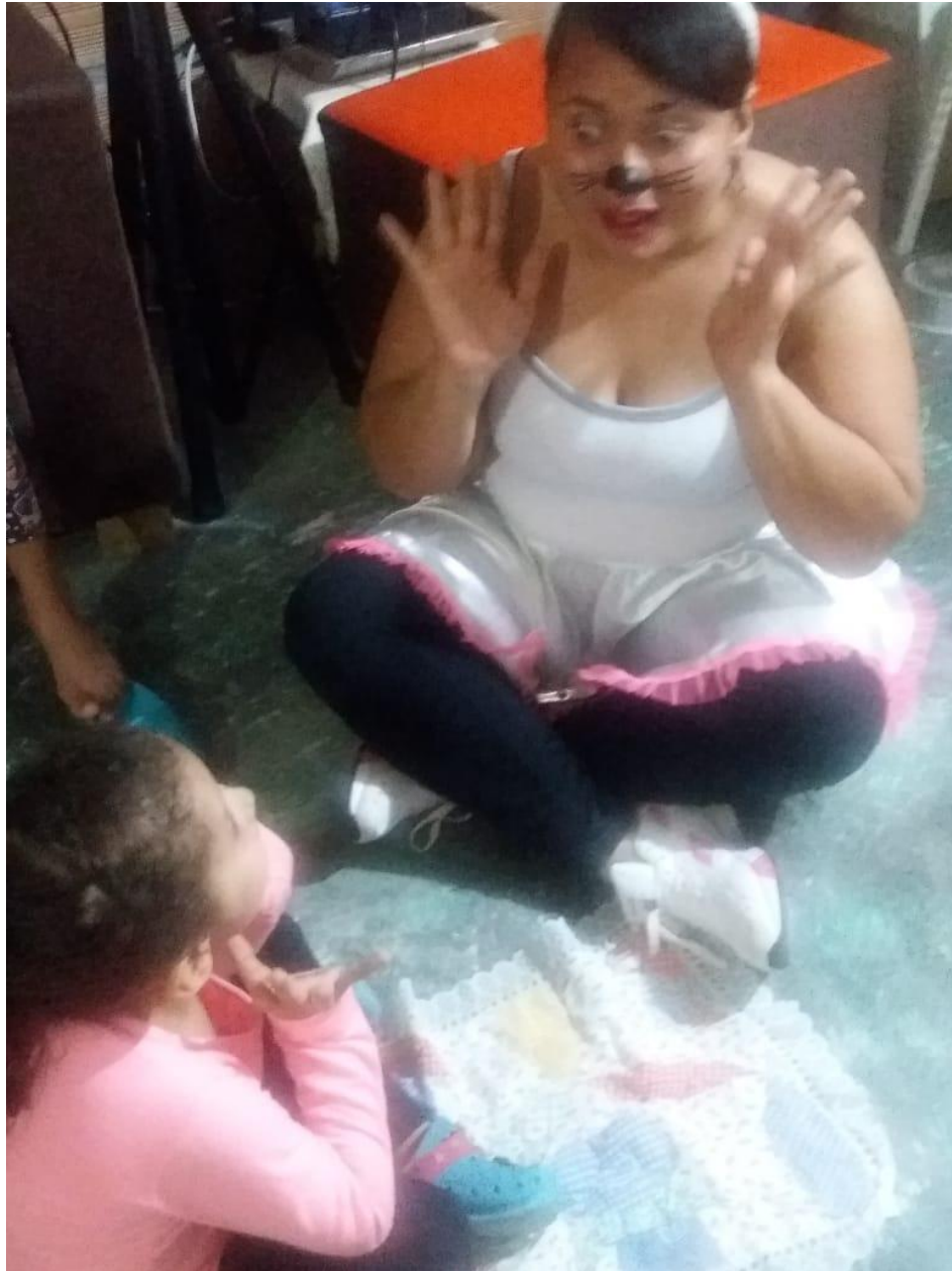
Fuente: taller con los niños y las niñas 27 de febrero de 2020