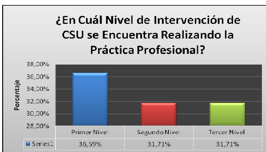
Ilustración 1: Pregunta realizada en la encuesta a los Trabajadores Sociales en Formación y se presta para confusión.