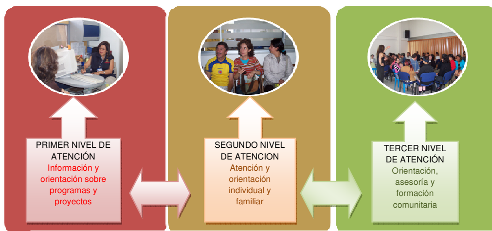
Ilustración 1- Los Niveles de intervención, no se desarrollan en un orden estricto, permite movilidad entre los mismos y se pueden desarrollar actividades mixtas o conjuntas.

El Consultorio CSU se estructuró en dos tipos de servicio: el primero a las autoridades locales en el que se presentan tres niveles de intervención; el segundo es el servicio hacia la población, también presentado en tres niveles de intervención, 4 orientados hacia la obtención de un impacto cada vez mayor a nivel local y la conformación de grupos poblacionales que puedan movilizar sus recursos y propuestas para hacer valer sus derechos como ciudadanos.