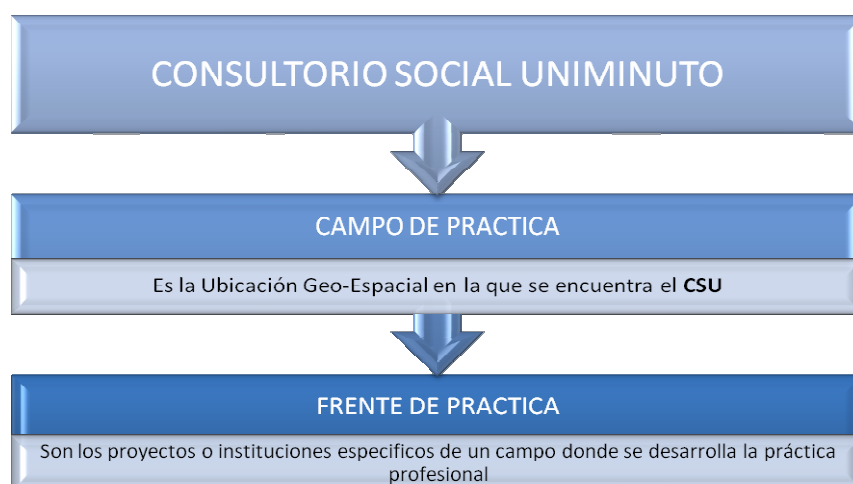
Grafica: Ejemplo: Campo de práctica localidad de Suba en el frente: Madres Gestantes (proyecto de la SDIS).