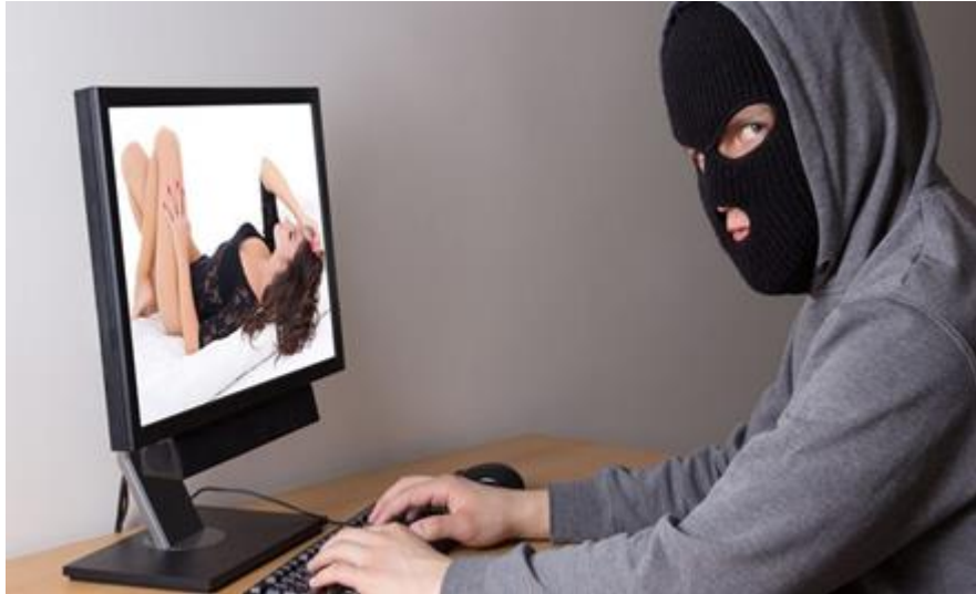
Figura 5 ejemplo Sextorsión