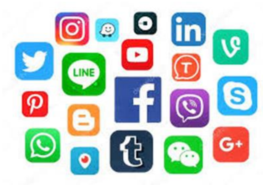
Figura 1: Ejemplo de tipos de redes sociales

Tomada de: Silva, J. (2019).Redes más utilizadas. recuperado de: