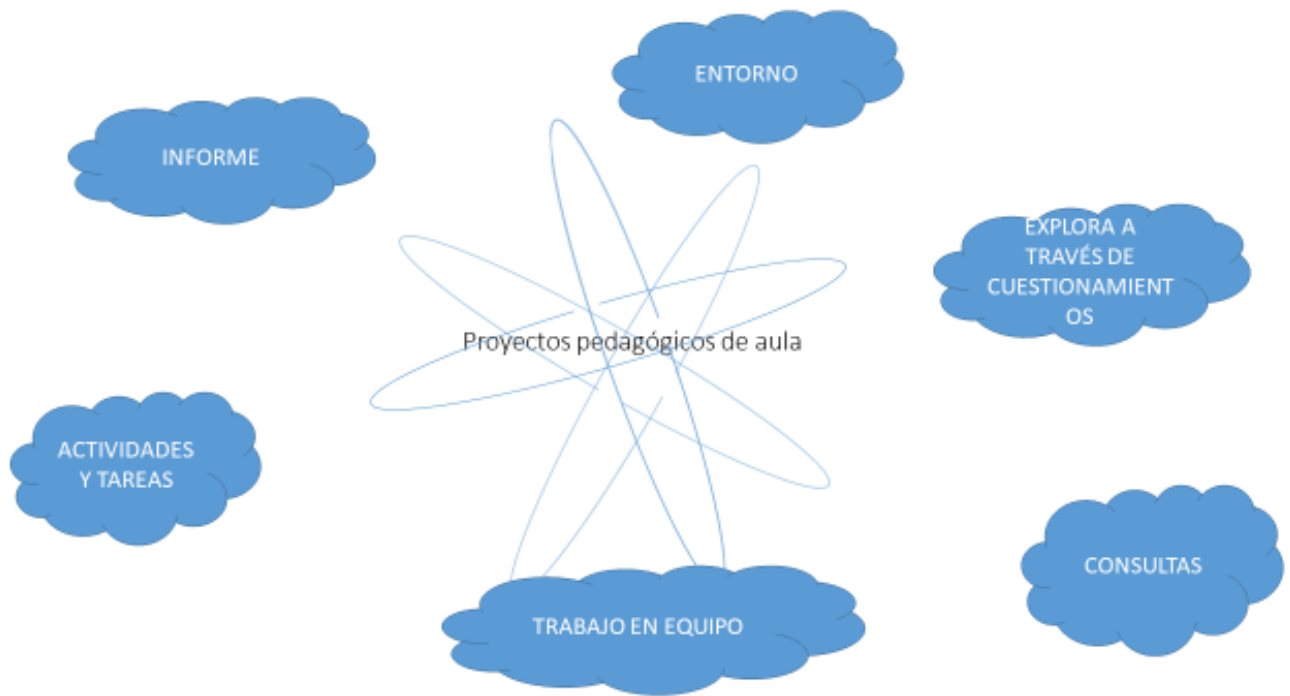
Figura4. Esquema proyectos pedagógicos de aula