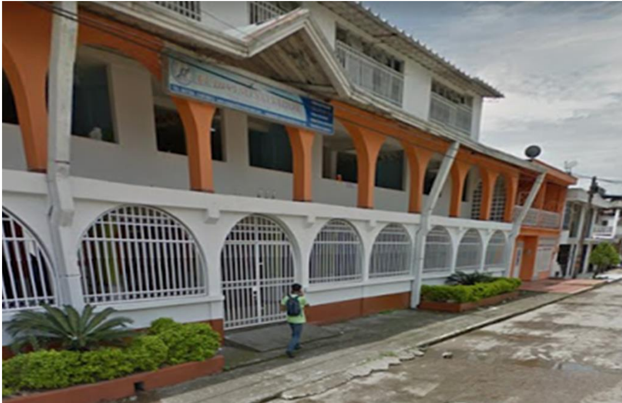
Figura 3. Ilustración Icolegio Divino Salvador Villavicencio

Cuenta con más de 70 colegios públicos y privados, ubicadas en las diferentes zonas tanto rurales como urbanas de la ciudad contando que ciertos de estas instituciones brindan una educación bilingüe, Instituciones que son campestres, Instituciones militares