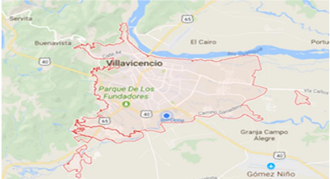
Figura 2. Villavicencio –Meta. https://goo.gl/maps/GUNKxk9KLP72

Villavicencio es un municipio colombiano, capital del departamento del Meta y es el centro comercial más importante de los Llanos Orientales. Población: 495.200 (2016)