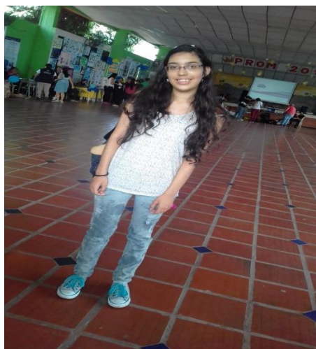
Ilustración 2 Fotografías del estudiante sujeto de investigación