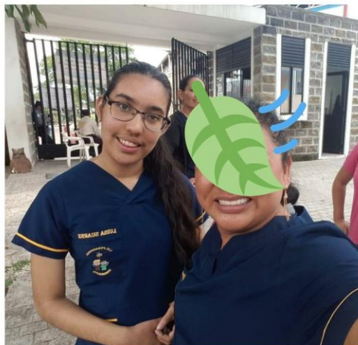
Ilustración 1 Fotografías del estudiante sujeto de investigación