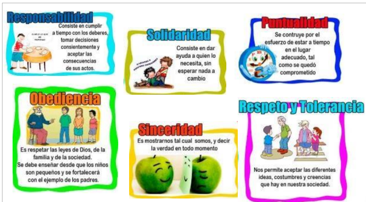
Figura 1. Principales valores para fortalecer

Se empieza con el ejercicio concreto de las actividades que se plantearon en la propuesta de intervención. Se cuenta con un plan de 15 actividades a desarrollar en la que cada una de las mismas tienen acciones en la que los estudiantes interactuaban entre si buscando así de socializar, construir valores que reforzaran el respeto mutuo, la tolerancia e inquiriendo mejores relaciones de convivencia ciudadana.