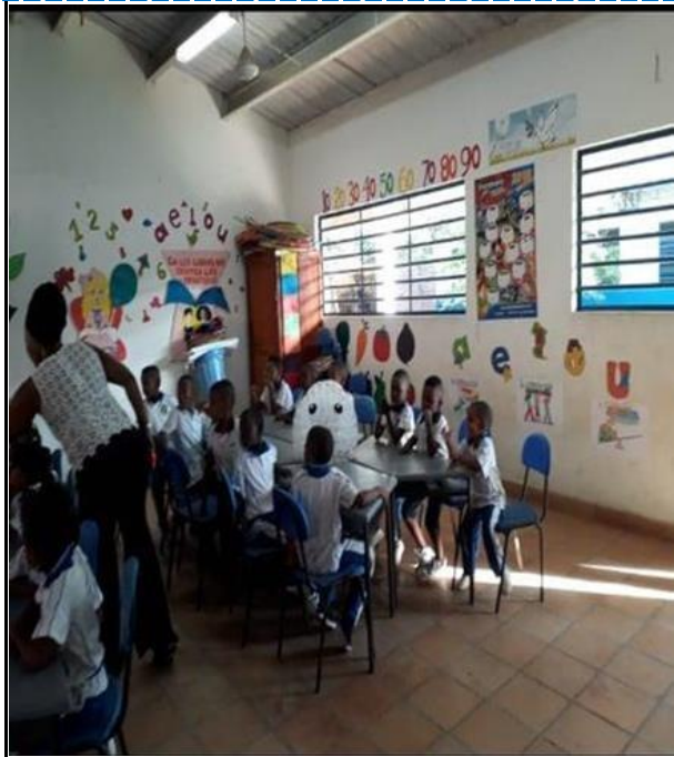
Anexo 1. Evidencia de Fotográfica 1