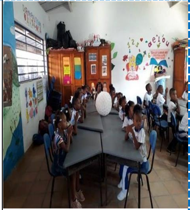
Anexo 2. Evidencia de Fotográfica 2