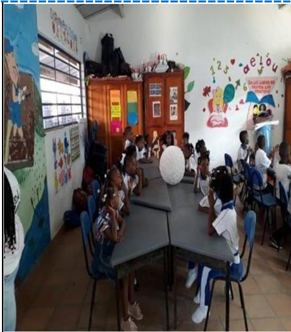
Anexo 3. Evidencia de Fotográfica 3