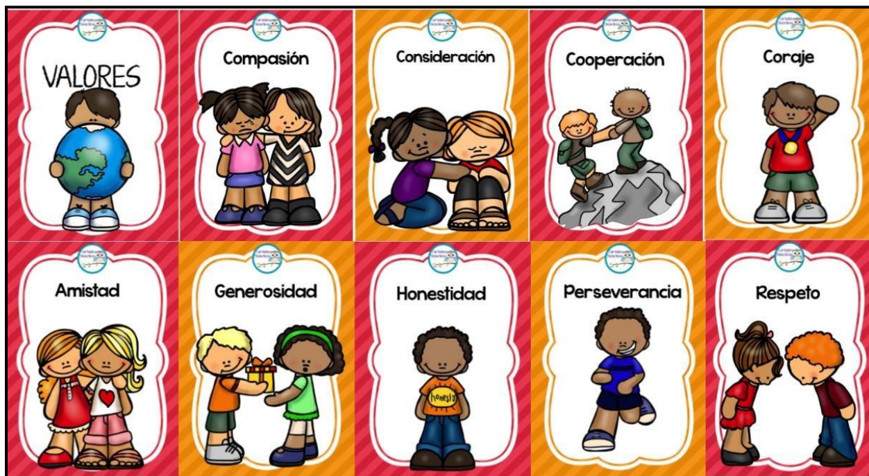
Figura 2 – Valores que aportan a la sana convivencia

Es importante resaltar que los estudiantes siempre van hacer el mayor motivador para buscar estrategias que ayuden al docente en formación a desarrollar planeaciones que den soluciones oportunas, es por esto que desde este proceso de sistematización se proponen recursos para desarrollar actividades que mejoraran la convivencia escolar en diferentes situaciones.