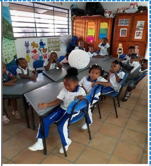
Anexo 4. Evidencia de Fotográfica 4