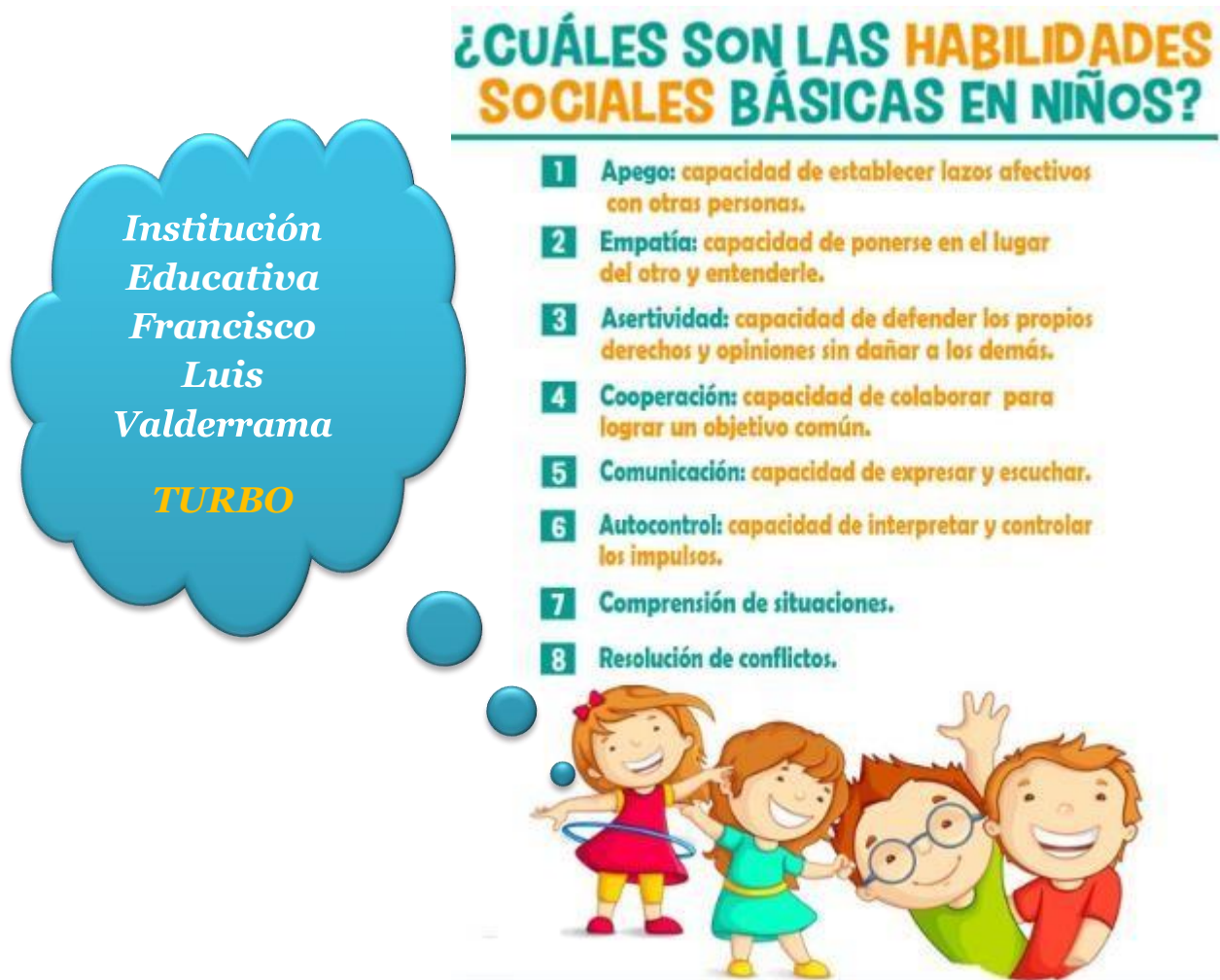
Figura 3. Habilidades sociales básicos en niños