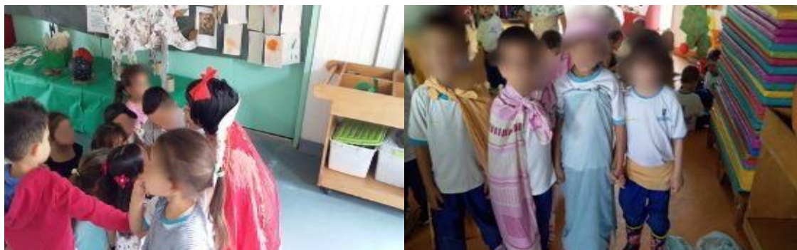
Lectura de cuento y dramatizado