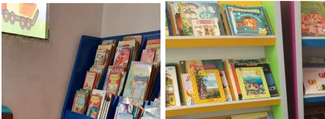
Imágenes de la biblioteca

Nombre de la actividad: Lectura de cuento y dramatizado