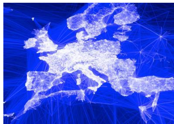
Imagen 2. ( Visualizing Friendships de Paul Butler 2010).

En los hallazgos se encuentra que al analizarlas las dos imágenes conllevan a las siguientes reflexiones la imagen de Butler, no representa las costas, ni los océanos o fronteras políticas, sino relaciones humanas.