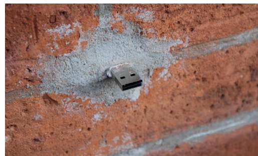
Imagen 3. Aram Bartholl conectado a uno de los “ dead drops ”. Imagen 4. un punto USB insertado en un muro.

La propuesta anterior evidencia como el ser humano interactúa en diferentes formas respecto a las relaciones con su ciudad.