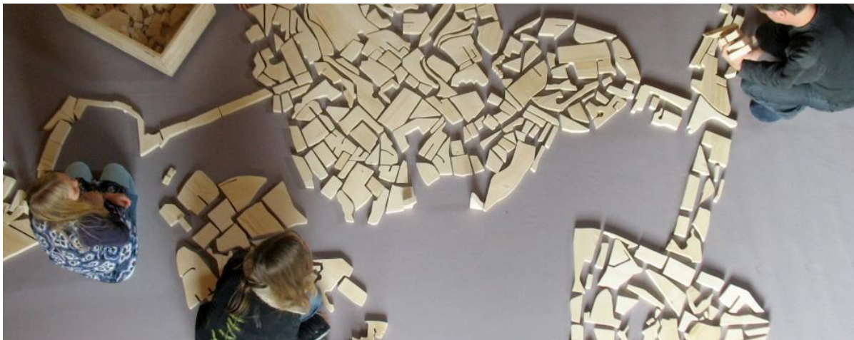
Imagen 5. Puzzle creado a partir de Les villes Rangees (fragmento). Fuente: Armelle Caron. Imagen extraída del artículo de Alejandro Orellana (2013) 4

cada uno de los edificios, parques, plazas, etc. Tras el despiece, reubicaba todas las formas obtenidas en filas. El aspecto final es cuanto menos curioso, parecen piezas de maqueta listas para ser ensambladas. Desde luego, su inicio metodológico es muy técnico y de carácter individual, pero hay más, algunos de los planos que utilizó posteriormente fueron impresos en piezas gigantes y recortadas, generando una especie de puzzle. (juego de habilidades que trata de recomponer una figura o imágenes combinando varias piezas) este, una vez separadas sus piezas, es prácticamente imposible de reubicar exactamente como el plano original, pero nos ofrece la posibilidad de crear formas más imaginativas, mejor organizadas o más prácticas que el original. Es fácil observar las posibilidades de acción de este ‘puzzle’, desde usarlo en un performance, a realizar talleres en centros culturales de la misma ciudad o barrio.