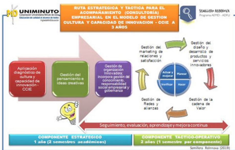
Grafico 2. Ruta estrategia y táctica para el acompañamiento empresarial del modelo de gestión CCIE.

Como segundo resultado se propone una ruta estratégica y táctica para el desarrollo del acompañamiento y consultoría empresarial, articulando el trabajo Uniminuto CR Cúcuta- microempresa, desde las prácticas profesionales del Programa de Administración de Empresas y Administración Financiera y el apoyo de Educación Continua en temáticas de mayor especialidad y profundidad. Esta ruta contempla el trabajo de acompañamiento y consultoría por un periodo de 2 a 3 años para fomentar la cultura y capacidad en el mediano plazo y sea más sostenible su interpretación y hábito en el quehacer empresarial