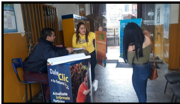
Foto 3 y 4. Sensibilización áreas administrativas de sede Quinta del Centro Regional Ibagué, con la participación del Club ambiental.

El día 28 de mayo de 2019 a las 3:30 pm.