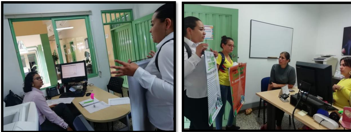
Foto 1 y 2. Sensibilización áreas administrativas de sede Chicalá del Centro Regional Ibagué.

A continuación, se registran las evidencias fotográficas de dicha actividad,