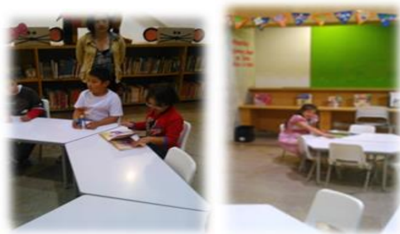
Figura 6. Fotos de Niños participando de lectura dirigida

Durante esta actividad se hicieron algunas consultas a los niños que diera respuesta a preguntas como gusto, agrado e interés por la actividad propuesta, teniendo en cuenta las características cognitivas de los participantes de la investigación se realizaron cuestionamientos sencillos como ¿les gusta los libros?, ¿Quieren quedarse en la biblioteca?, ¿quieren volver a ver el libro?, y se obtuvieron las siguientes respuestas: