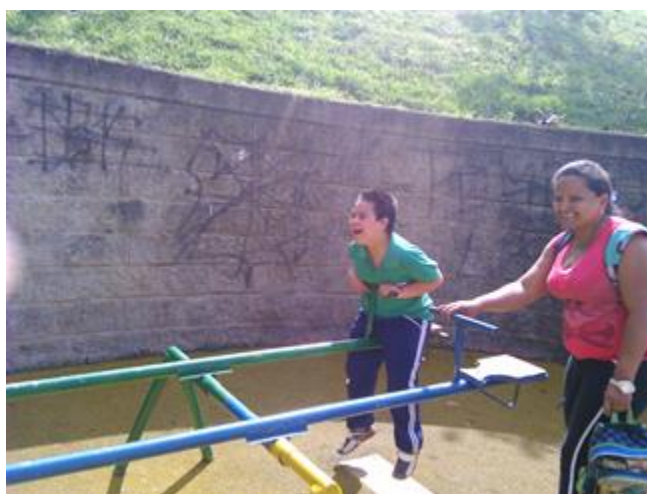
Figura 12. Imagen de Niño jugando en el parque recreativo

Por otra parte los participantes evidenciaron durante el acercamiento en las diferentes actividades que no cuentan con el conocimiento de mecanismo de intervención y reclamación de derechos fundamentales, haciendo difícil el proceso de comunicación y mejoramiento de servicios públicos y privados dispuestos para este tipo de población. Así mismo se evidenció que una de las principales barreras que no permite el ejercicio del derecho a la participación y utilización de espacios públicos, culturales y recreativos están relacionadas con la violencia urbana, bajos recursos económicos de las familias y poca difusión en medios de comunicación comunitarios para la inclusión de las personas con discapacidad.