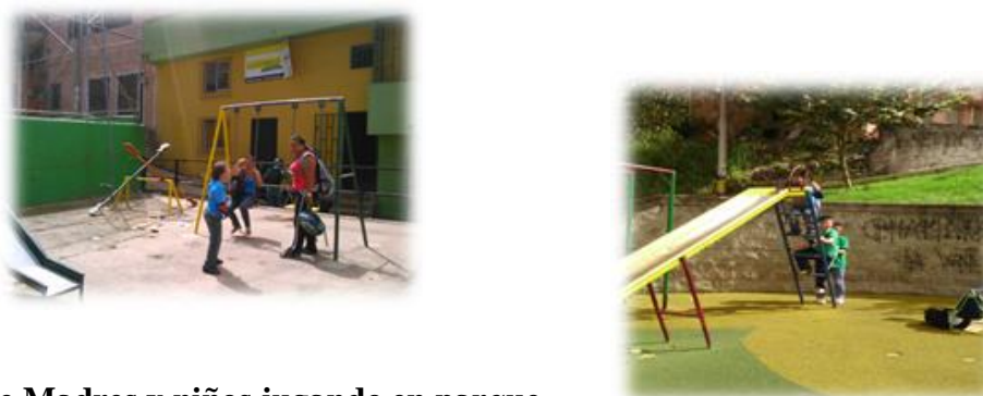
Figura 3. Fotos de Madres y niños jugando en parque público

Los N participantes solicitaron juegos y/o atención de manera inmediata, requiriendo orientación de parte de los adultos que se encontraban en el lugar, durante el recorrido no se presentaron agresiones entre los participantes. Este cuestionario nos permitió visualizar algunas características y comportamientos de los niños con discapacidad frente a las actividades y mecanismos existentes para la vida comunitaria social y cívica, algunas barreras y potencialidades dentro e su contexto cercano, al igual que la forma como éstas son enfrentadas.