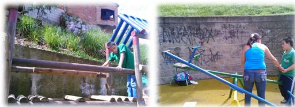
Figura 4. Foto de Parques recreativos en mal estado.

pasividad frente a estos eventos se sustenta en la falta de formación ciudadana y la poca exploración de posibilidades cercanas.