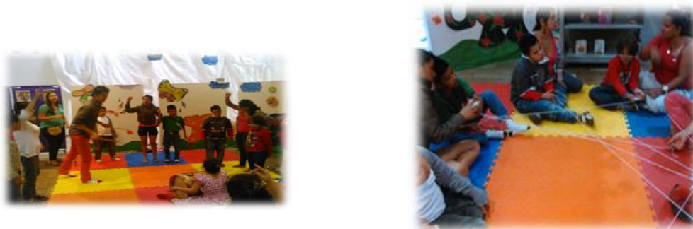
Figura 8. Fotos de Participación de los Niños en la Hora del Cuento

Según la CIF la categoría de Tiempo libre y ocio constituye las acciones de participar en cualquier tipo de juego, actividad recreativa o de ocio, tales como juegos y deportes informales y organizados, programas de ejercicio físico, relajación, diversión o entretenimiento, ir a galerías de arte, museos, cine o teatros; participar en manualidades o aficiones, leer por entretenimiento, tocar instrumentos musicales, entre otras que produzcan placer y satisfacción personal.