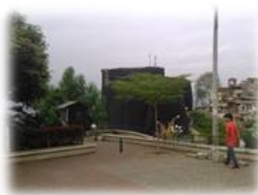
Figura 1. Foto de Espacio público cercano a la Biblioteca España. Barrio Santo Domingo Savio.

“Este lugar es bonito, pero no subimos casi hasta acá, preferimos quedarnos en la casa”- AC M2, frente a esto el ACN2 ríe asentando la información brindada.