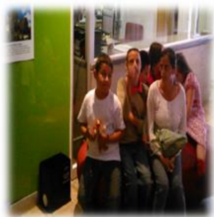
Figura 7. Foto de Niños en la Biblioteca España

AC M1. “Cuando mi hijo está en otros lugares se distrae y yo no me canso tanto con él como cuando estamos en la casa, él no sabe qué hacer allá en la casa encerrado”