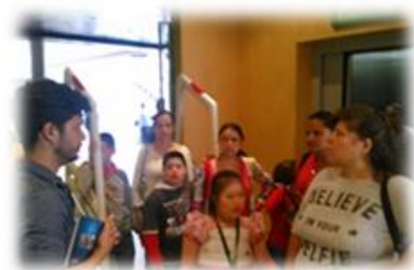
Figura 5. Foto de visita guiada a la Biblioteca España

este tipo de actividades genera para el desarrollo de los niños con discapacidad intelectual, dichos beneficios se exponen en términos de posibilidades identificadas en sus contextos y los facilitadores o barreras que se reconocieron gracias a la información brindada por los participantes.