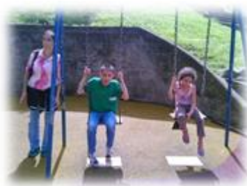
Figura 2. Foto de niños disfrutando de parque recreativo del barrio Granizal.

Este tipo de comentario evidencia, que aunque dentro del grupo familiar se reconoce el gusto del niño por salir a disfrutar del espacio público, éstos no lo hacen con frecuencia, sustentando así las afirmaciones reveladas en la entrevistas iniciales sobre la poca participación de los niños y las dificultades a nivel familiar para apoyarlos en estas actividades aun cuando existan los espacios para hacerlo, es decir, no se aprovecha al máximo los recursos disponibles en su entorno cercano.