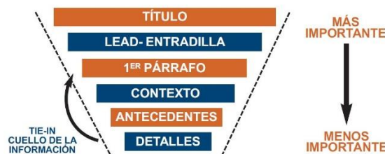
Figura 1: pirámide invertida

Plano Significado/texto, en el nivel temático de los significados globales se busca indagar cuáles son los temas a los que se les da importancia en la noticia intentando encontrar el “qué” y el “cómo”: de qué trata la noticia y describir la manera en que lo realiza. Para este nivel, la tarea se facilita debido a la estructura de “pirámide invertida” utilizada por los periodistas que sintetiza lo más importante de la noticia en el titular o en la entrada de cada una de éstas.