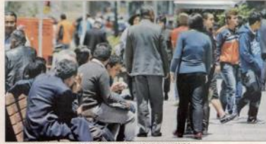
EL DESEMPEÑO fue alto en las ciudades del centro y el sur del país durante 2017

GRANDES DESPARIDADES en materia de desempleo durante 2017 se registraron entre las distintas regiones del país, según los análisis de los expertos. Un estudio realizado por ANEP señala que en materia de creación de puestos de trabajo se destacaron las ciudades del norte de Colombia, frente a las del sur. Según el estudio, las ciudades del norte del país continuaron registrando los niveles más bajos de desempleo, significativamente inferiores al promedio nacional. En efecto, durante el periodo octubre-diciembre de 2017, se destacaron Barranquilla, con un desempleo de apenas un 7,5% y Bucaramanga 8% con registros inferiores al 9,6% del desempleo nacional urbano en las 13 áreas estudiadas.