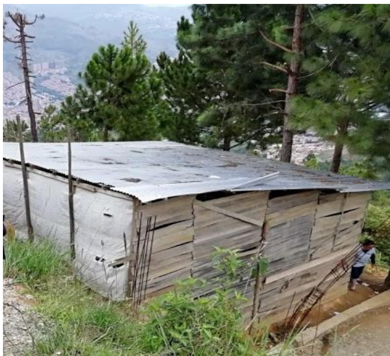
Figura 1. La escuela, sector torre 11. Elaboración propia.

historias diferentes: “la forma en la que está construida la escuelita, la cual se reduce prácticamente a un solo salón, éste está construido únicamente de madera y algunos costales de fibra, el suelo como ya lo mencionamos es en tierra lo que genera que en lluvias este se vuelva pantanoso” (Diario de campo 7).