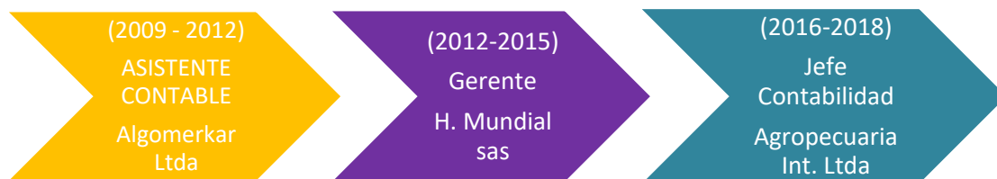
Ilustración 3 Línea de Tiempo

Lo primero que se debe realizar luego de haber cerrado y los estados financieros es generar un Balance de Comprobación generado por el sistema contable utilizado por la empresa, luego se procede a la realización de las notas a los estados financieros de una forma comparativa de los dos últimos años al mismo corte, estas notas es la transcripción de todas y cada una de las cuentas explicando a que corresponde cada rubro. Estas notas se elaboran en Excel y están formuladas de tal manera que automáticamente se van haciendo automáticamente el Estado de Situación Financiera y el Estado de Situación Financiera, así como el estado de Cambios en el Patrimonio y Estado de Flujos de Efectivo.