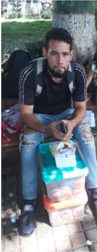
Vendedor informal 2.