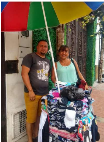
Vendedor informal de medias