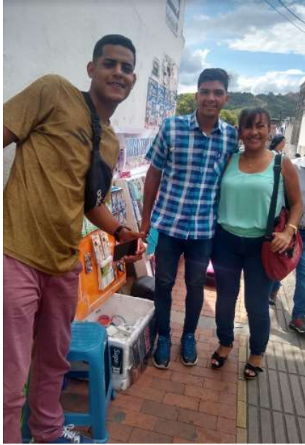
Vendedor informal 3.