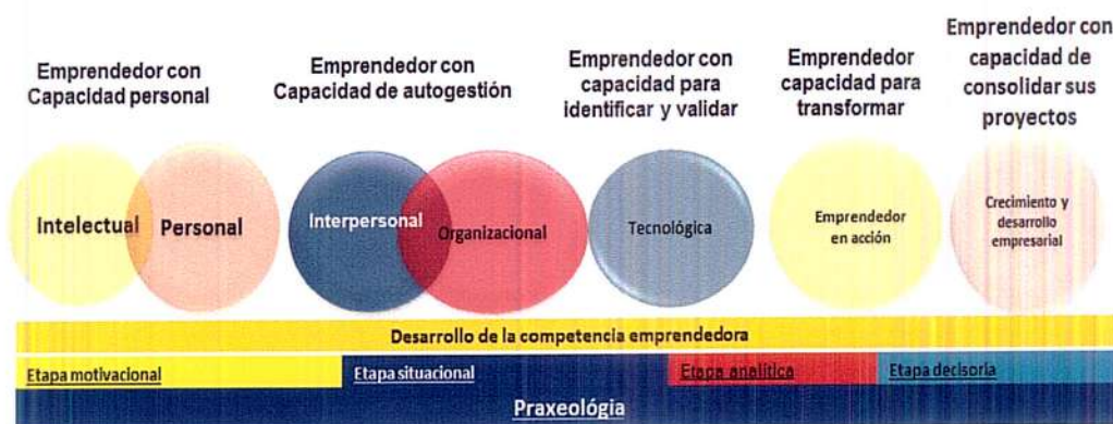
Ilustración 1. Dimensiones para el diseño de la formación en emprendimiento que hacen parte de la ruta de formación

Son cinco dimensiones los ejes que orientan el diseño de la propuesta formativa y se convierten en los elementos transversales y globales que potencian la consolidación de un perfil emprendedor. Estas dimensiones son: