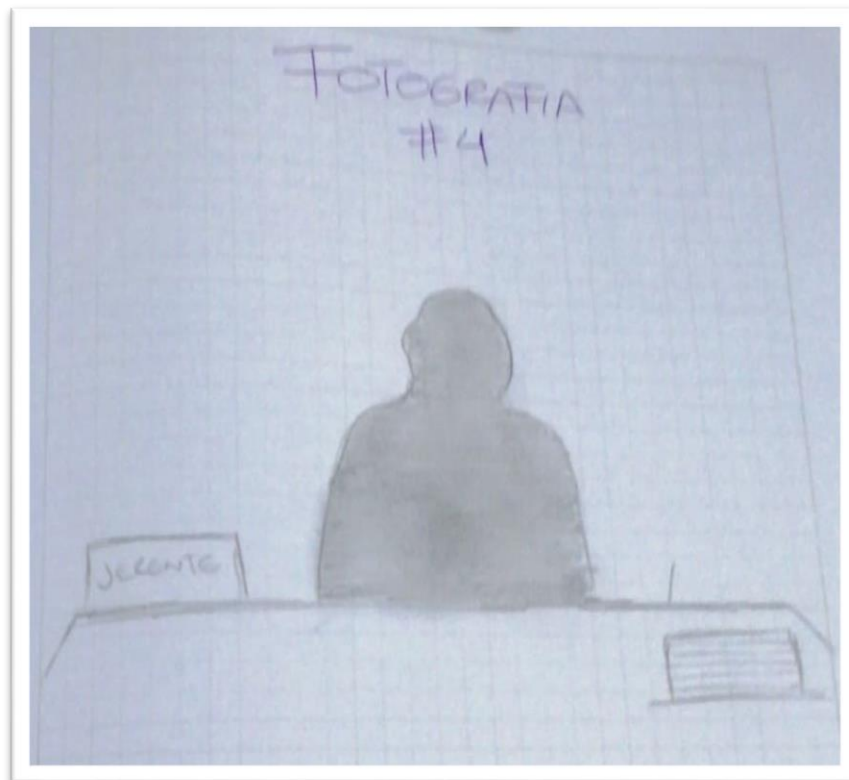
Fotografía14. Equidad salarial

En esta fotografía se refleja cómo pueden las mujeres sufrir de una discriminación laboral, esta consiste en tener una mujer sentada enfrente de un escritorio y al costado estará sentado un hombre con el mismo cargo, es allí donde se refleja el desgaste de laboral que puede sufrir las mujer y siempre por un salario económico más bajo que el de un hombre.