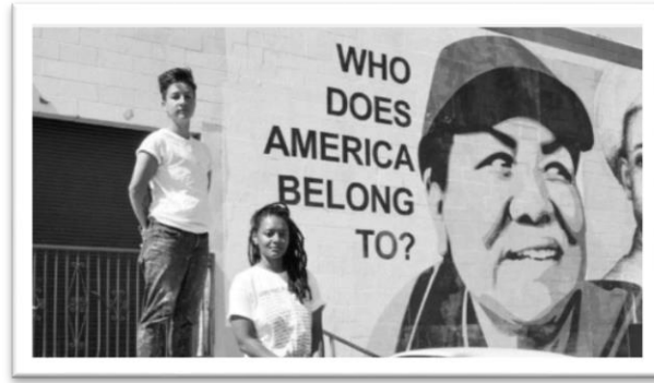
Fotografía2. Quien pertenece América

El rostro es el espejo del alma, dejando ver todos las emociones y sentimientos que nos llenan la vida de aventuras, es allí donde entra a jugar Bamboo (allthesehumans), fotógrafo y retratista reconocido en redes sociales, que muestra a la sociedad los rostros de los extraños seres humanos, los cuales pueden sentir un tipo de rechazo, su proyecto más reconocido es “AllTheseHumans” en el cual por medio de videos y fotografías le muestra al mundo que los seres humanos no somos iguales y podemos romper barreras que pueden separarnos..(Iñigo, All These Humans) Este gran artista nos deja una enseñanza que muchas veces dejamos pasar, es ver cómo los rostros pueden expresar un sin número de emociones que vive la sociedad, es allí donde Bamboo aporta la técnica de retrato, pero no un retrato por una cámara sino la conexión que puede tener este retrato con historias y experiencias que los seres viven diariamente, dejando marcas en la vida de ellos, que sin pensarlo pueden salir a la luz por un solo gesto.