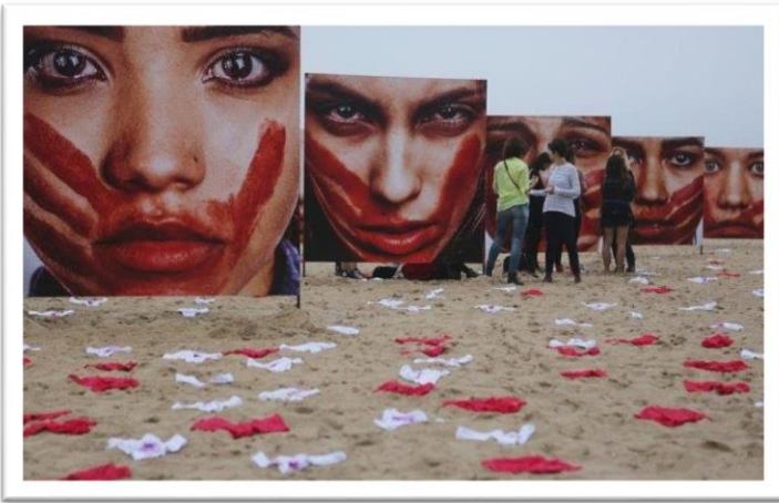
Fotografía5. Nunca Callaré

diferentes motivos.(mostrador, 2016), es importante recalcar que las situaciones relacionadas con las violencias de género son huellas que quedan marcadas en la vida de cada personaje y estas se van convirtiendo en gestos de discriminación a la hora de salir a luz pública, es por eso que este artista aporta una gran colaboración a mi trabajo, dejando claro este tema como punto de discusión.