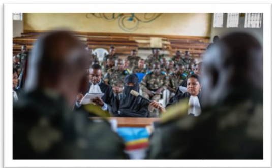
Fotografía6. El juicio por violación de Minova

demostrar por gestos los dolores que esto causa en sus vidas.