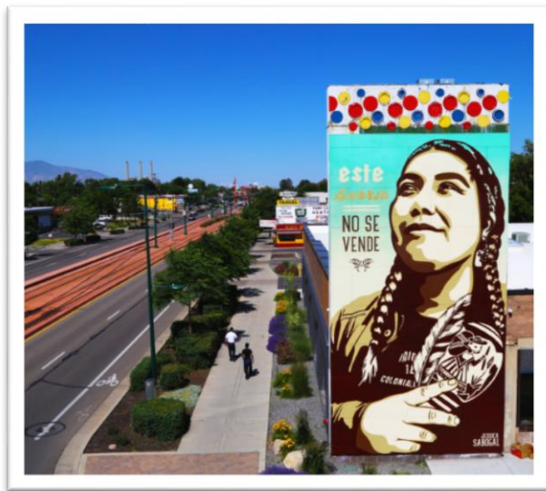
Fotografía 1. Quien pertenece América

Es el momento de darle continuidad a este trabajo profundizaré en la búsqueda de materiales, opiniones y técnicas que ayudaran a la sostenibilidad teórica de este trabajo. En este camino me encontré con Jessica Sabogal, una artista muralista Colombiana y Estadounidense quien se encarga en generar conciencia sobre la discriminación hacia la mujer, comunidad LGTB, los emigrantes en Estados Unidos, su trabajo más famoso es “La mujer es mi religión” (Sabogal) Mi perspectiva frente al trabajo de esta artista es ver como ella ha sido capaz de demostrarle a la sociedad por medio de sus murales y sus obras de arte las situaciones que diariamente viven las personas en América, dejando un legado directo o indirecto en las personas. Estas obras aportan a mi trabajo la claridad de los rostros y la transparencia que esta llega a detallar en cada mural.