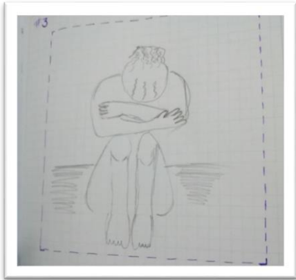
Fotografía 12. Un mundo en silencio