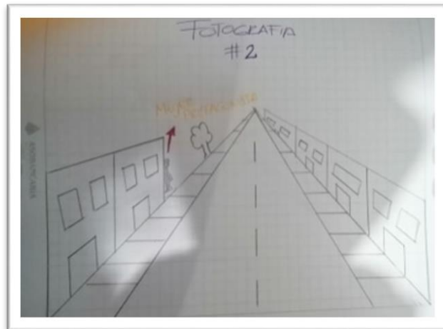
Fotografía11. Lucha por mi familia

En esta fotografía estará una mujer de bajos recursos con sus hijos, buscando una manera de conseguir dinero, para esta fotografía se tomará en la calle, específicamente en la calle 19 barrio Santa fe, donde se encuentre esta mujer en una de las esquinas de este dichoso barrio, a su lado están sus hijos con cabizbajos y lágrimas en sus ojos.