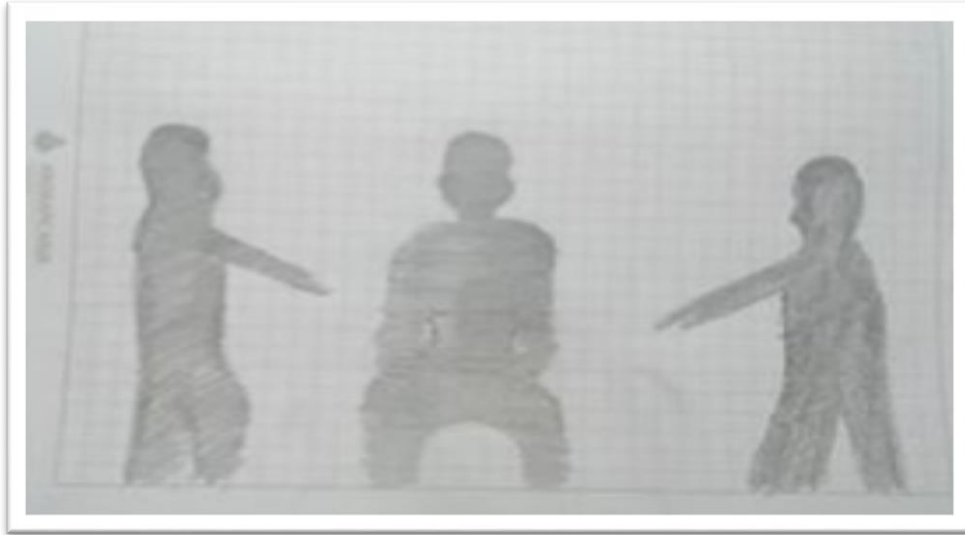
Fotografía10. Un mundo sin salida

estuvieran varias personas en forma de círculo y la sombra de cada uno de ellos estuvieran apuntando al personaje del centro.