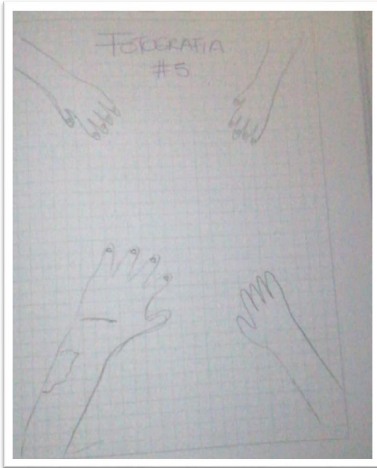
Fotografía15. Manos diferentes

imagen #5 Descripción: La mano herida significa la lucha que muchas personas han tenido en su vida y son marcas que pueden quedar en el físico, tanto como en la memoria de cada uno de nosotros.