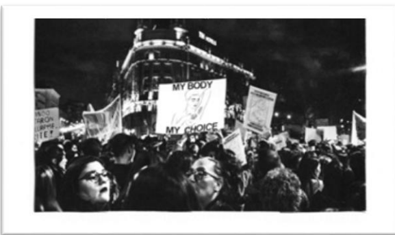
Fotografía7. Donna Ferrato

Para reforzar la información que nos ha brindado la anterior artista, está Donna Ferrato (Ferrato, 2019) es una fotógrafa estadounidense que ha ganado el premio PHotoEspaña 2019 con la exposición HOLY, enfoca su trabajo a las mujeres que han sufrido violencia de género, la lucha de la igualdad y la revolución sexual a la que ha estado expuesta la mujer durante décadas. Recalca en cada obra la importancia de la lucha por la desigualdad, para tener un mejor vivir, liberándose de una discriminación social. Esta artista aporta a mi trabajo la manera de ver las cosas desde un punto de vista más humano, dándole a la persona una voz de seguridad para poder expresar estas cosas que muchas veces agobian y no nos deja prosperar.