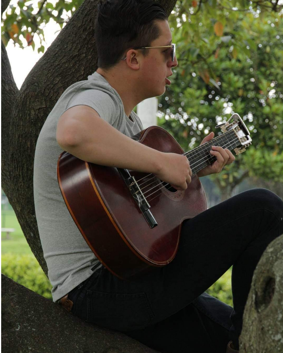
Fotografía 1. Spiritualiter