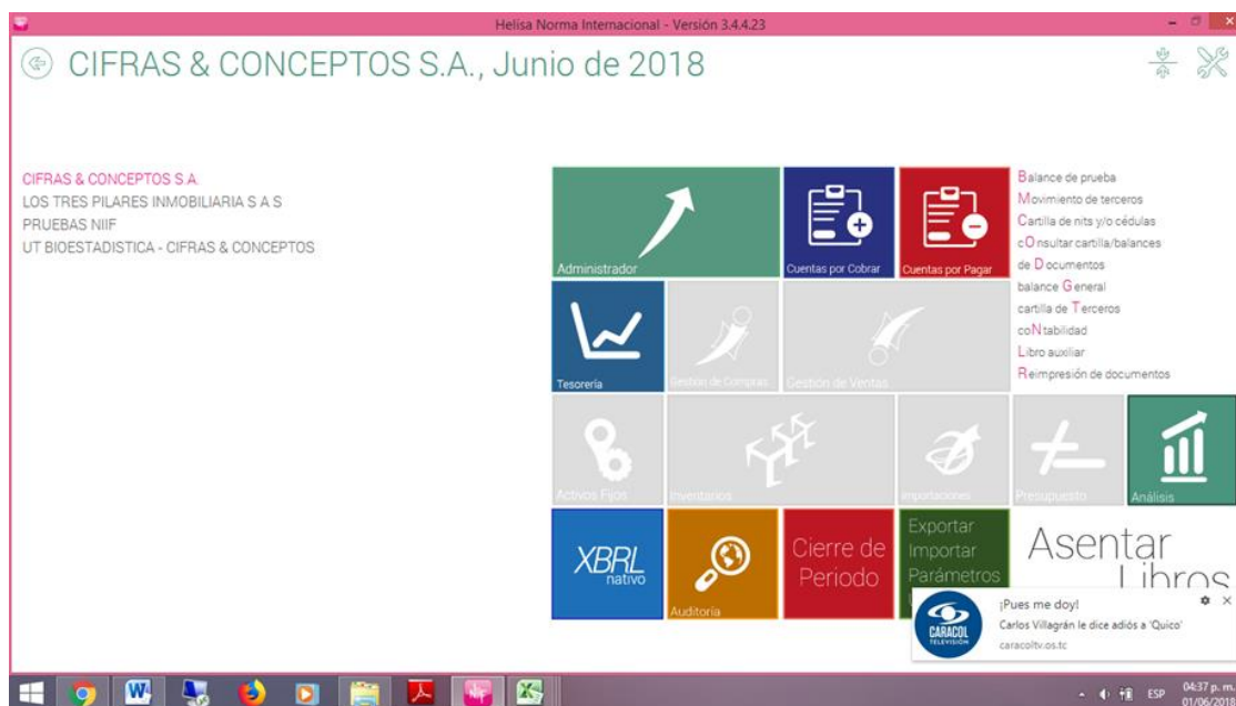
Figura 3. Sistema Helisa Norma Internacional. (CIFRAS Y CONCEPTOS SA, 2018)