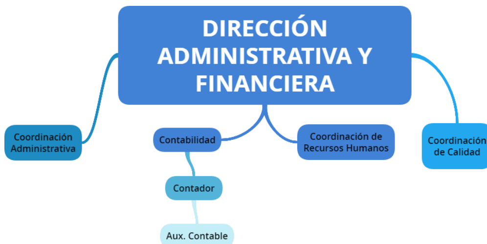
Figura 2. Organigrama del área de trabajo de la empresa CIFRAS Y CONCEPTOS S.A.