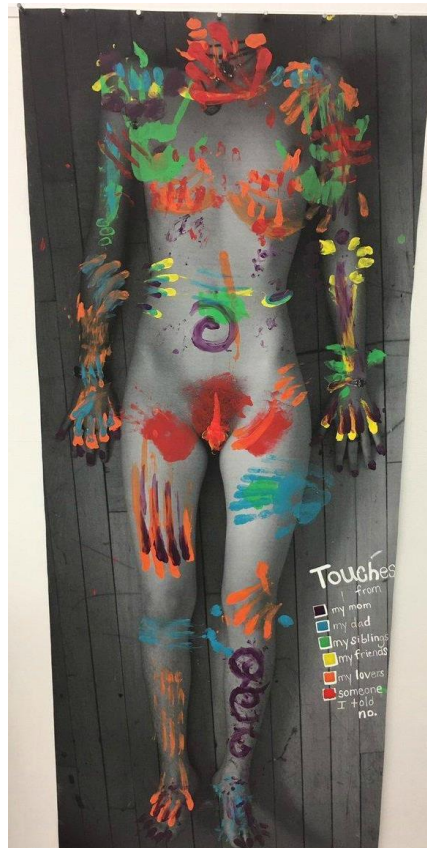
Ilustración 1. Si el contacto dejara rastro. Obra de Emma Krenzer. 2018

Entendiendo la gravedad de las consecuencias ocasionadas por este tipo de violencia, varias artistas han decidido romper el silencio; y a través de sus obras, plasmar la memoria de los dolores y sentires de las víctimas, desde perspectivas físicas y psicológicas. Algunas de estas muestras artísticas son: