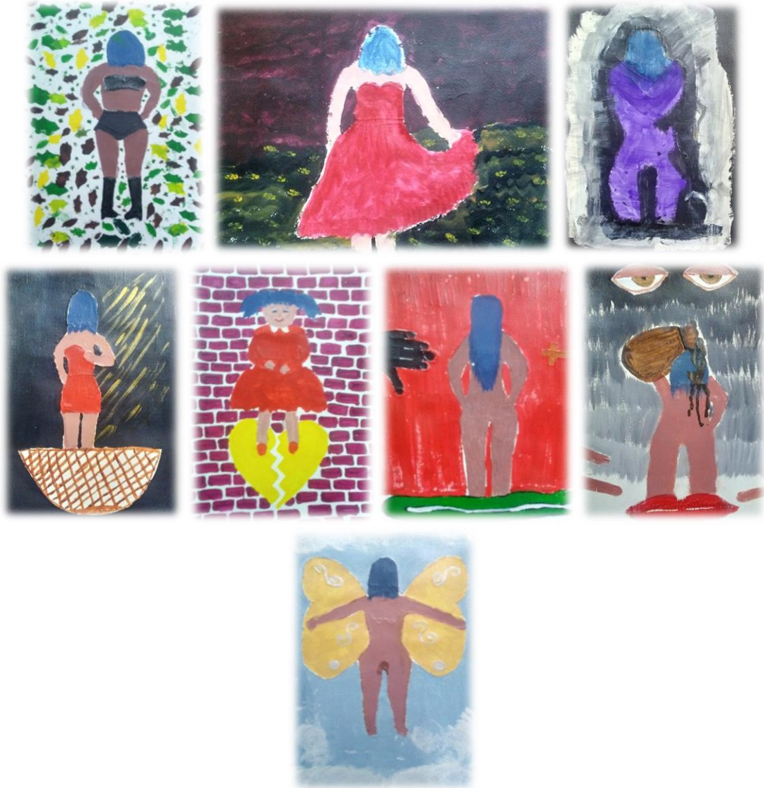
Ilustración 8. galería de obras resultado del proceso creador.

(Ver anexos 14 y 15" fotografías de la sustentación realizada")