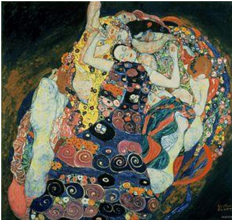
Ilustración 2. Die Jungfrau. Obra de Klimt, G 1913

intenciones de la protagonista y a la acción de la escena, invitando a conocer el sentir físico de las mujeres protagonistas, el desconcierto, la añoranza y en cierto modo el placer. Tomo a Klimt como inspiración, pues igual que él, mi simbología del color y la forma hace referencia a cuerpos femeninos y sus sentires, es claramente insinuante frente a las acciones en curso de la escena; y utiliza colores oscuros como fondo para ofrecer sentimientos de incomodidad, desesperanza, miedo, tristeza, etc. A la vez utilizando colores vivos para acentuar la intención, el protagonismo de la mujer y los elementos propios de ella. Además, algunos opinan que Klimt pintaba mujeres para mujeres, siendo prueba de ello, el gran número de éstas que compraban sus obras.