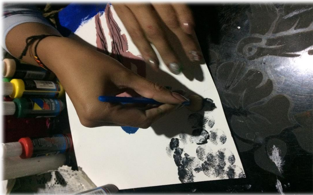
Ilustración 6. Construcción de fondos de la pintura, una vez realizado el trabajo con plantilla.

Después quité la plantilla y con manejo de pinceles, construí el fondo.