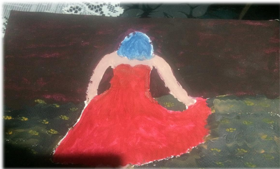
Ilustración 7. Pintura terminada, ya con sellador para su fijación.

Para finalizar aplico sellador y deajo secar.