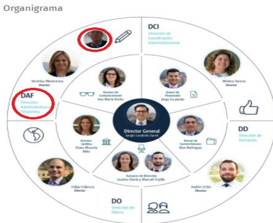
Figura 2. Organigrama de la Agencia Presidencial de Cooperación Colombia APC-Colombia.