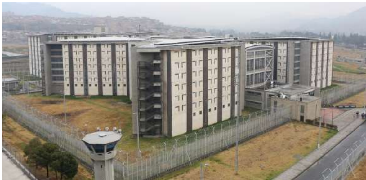
Ilustración 3 Estructura máxima seguridad