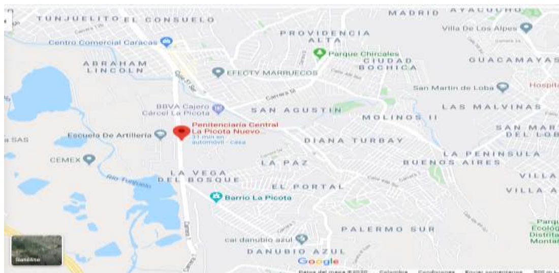
Ilustración 1 Localización COMEB