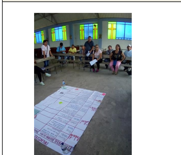
Lugar y actividad realizada