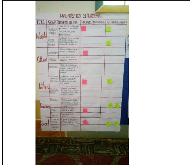
Lugar y actividad realizada