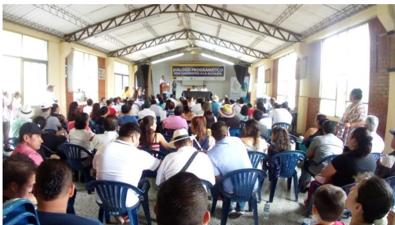
Imagen N°6 de autoría propia.

Al finalizar, se realizó un documento escrito en el que todos los presentes se comprometieron a aportar mayormente en procesos participativos que vinculen a todos los actores de la sociedad y los candidatos en particular de quien ganara se comprometieron a construir el plan de desarrollo de su gobierno de manera participativa, democrática y teniendo en cuenta las problemáticas y estrategias planteadas en los encuentros anteriores. (Imagen N°6)