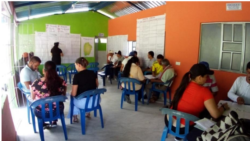
Imagen N°4 de autoría propia.

Posteriormente, con la intención de agilizar el trabajo debido a que algunos actores no disponían de una gran cantidad de tiempo, se les solicitó que finalizando su modelo problemático integrado, reconocieran los puntos críticos, los puntos de ataque, y a partir de esto construyeran o planearan una estrategia que diera solución al punto de ataque identificado.