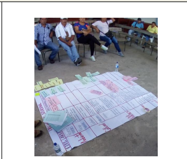
Lugar y actividad realizada