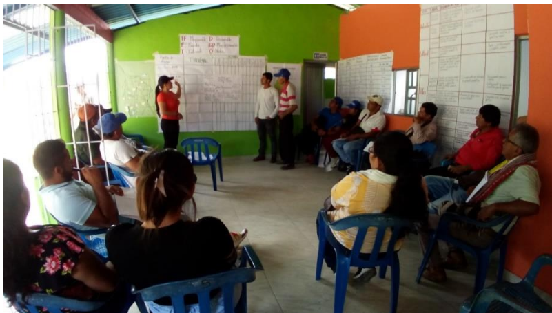
Imagen N°5

con el fin de la iniciación de la construcción de la plaza campesina en las veredas que lo necesitan.(Imagen N°5)