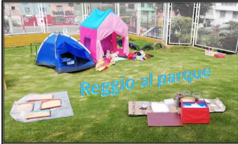
Ésta estrategia se desarrolló con las familias del nivel de prejardín del Jardín Amiguitos del Valle de Cafam, de la localidad de Usme

Imaginas esto en el parque de tu barrio?