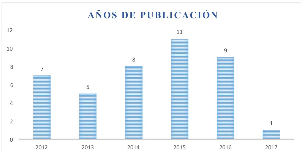
Gráfica N. 2 Año de publicación de las referencias bibliográficas consultadas en el tema de Infancias y Políticas Públicas.

La investigación documental es un proceso que implica una serie de pasos a seguir, es necesario establecer una relación dinámica de carácter metodológico, que tiene inicio, un desarrollo y un fin, y esta a su vez genera una secuencia en torno a los diferentes tipos de documentos que nos lleva a comprender el fenómeno social que se está estudiando. (Páramo, 2011, p. 199). A continuación se relacionan los años de publicación y la cantidad de documentos de los últimos 5 años, elegidos en la matriz de recolección