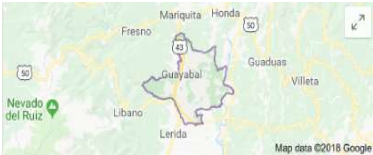
Figura 1. Mapa político de Armero Guayabal, Tolima, Colombia

Las fortalezas económicas del municipio de Armero provenían de los cultivos de algodón, arroz y sorgo, y de su pujanza comercial, pues para la década de los años ochenta del siglo anterior era catalogado como el eje comercial de la zona norte del departamento del Tolima debido a su ubicación estratégica y a que la carretera nacional lo atravesaba; se encontraba justo en el triángulo que une la región de los nevados con Bogotá, la capital del país. La avalancha provocada por el deshielo del Nevado del Ruiz a consecuencia de la erupción del Volcán Arenas, situado en el mismo nevado, sepultó el 13 de noviembre de 1985 al promisorio municipio de Armero; pasada la tragedia parte de los sobrevivientes se trasladaron al corregimiento de Guayabal donde se ubicó la cabecera municipal del que sería tiempos después el nuevo municipio de Armero Guayabal, creado mediante la ordenanza 013 del 28 de marzo de 1995 emitida por la asamblea departamental del Tolima.