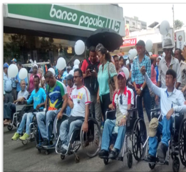
Fotografía 2. Protesta Noviolenta cortesía Profesor José Palacios.