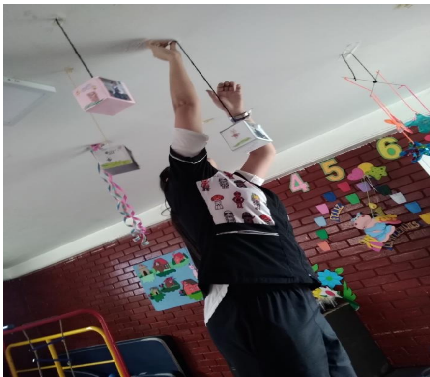
Figura 1547 Una vez finalizadas las cajas de personalidad proceden a ser organizadas por las investigadoras. Elaboración propia.