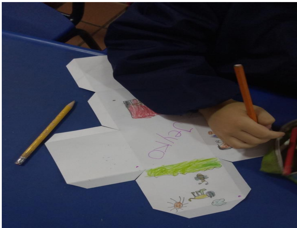
Figura 1416 El estudiante se encuentra realizando el cubo de la personalidad según la guía de la investigadora. Elaboración propia.