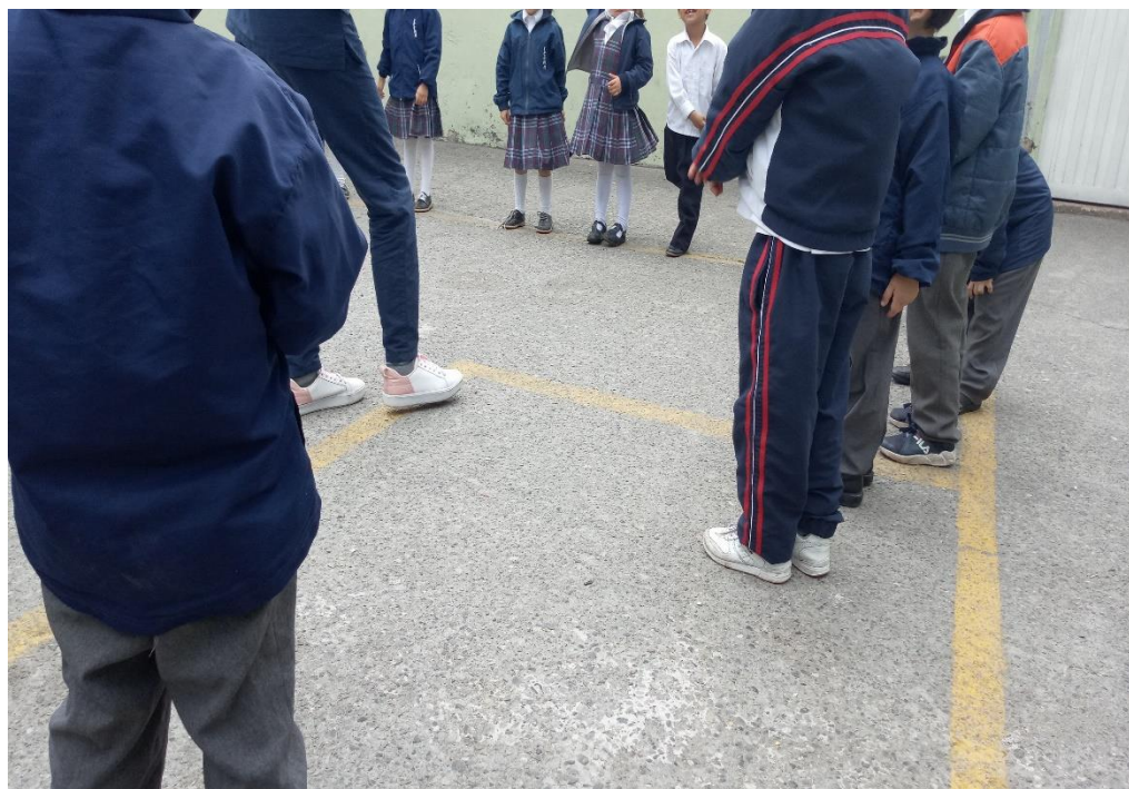
Figura 2 Presentación de la primera actividad propuesta para llevar a cabo el ambiente de motricidad gruesa.