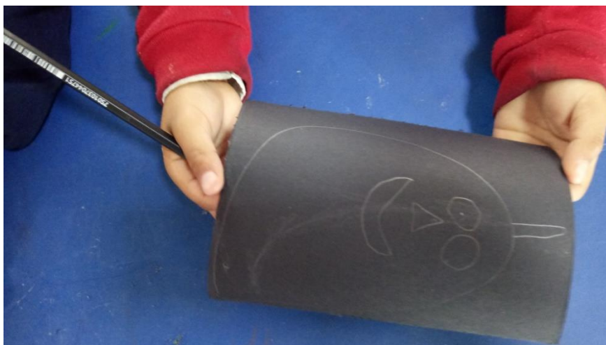
Figura 944 Dibujo de uno de los estudiantes de grado cero. Elaboración propia.