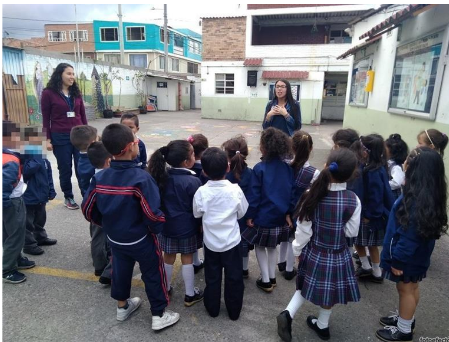
Figura 1 Actividad de integración y presentación en el ambiente de motricidad gruesa. Elaboración propia.

A continuación, se hicieron juegos de calentamiento, coordinación y equilibrio postural básico para reconocer la población y características específicas, del mismo modo se tuvo en cuenta el trabajo en equipo y la memoria de los estudiantes como parte de la observación, para así generar estrategias que cubrieran las necesidades que en ese momento se presentaron. Todo lo anterior se llevó a cabo por medio de recreación dirigida para así dar las pautas a cada actividad.