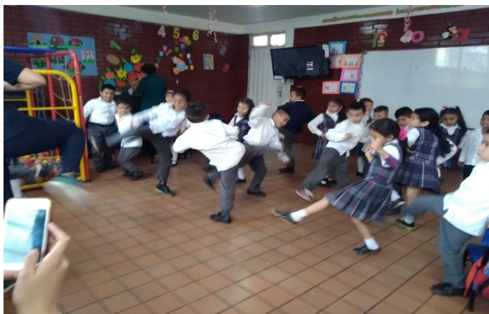
Figura 1820 Se realizan los ejercicios de flexibilidad antes de ejercer algún esfuerzo físico. Elaboración propia.