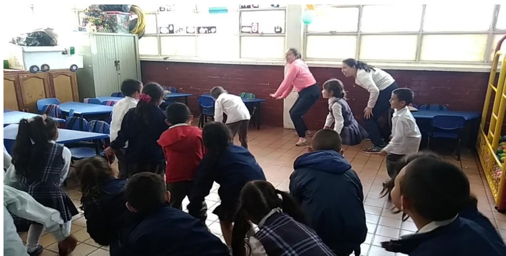
Figura 1749 Se realiza la organización y la composición de los grupos de danza. Elaboración propia.