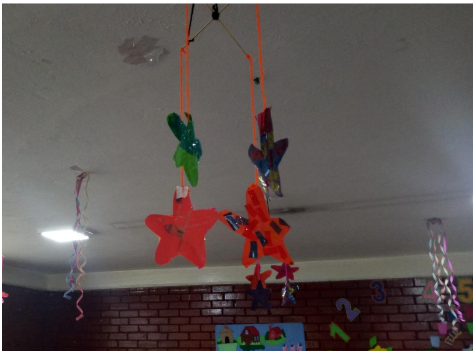
Figura 1345 Exposición de los móviles construidos por los estudiantes de grado cero. Elaboración propia.