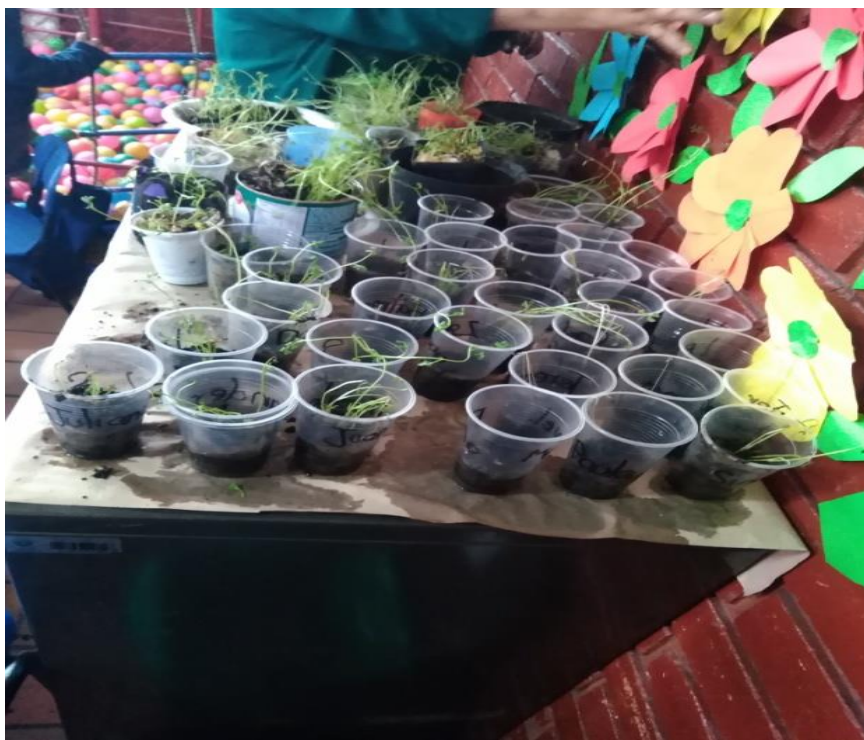
Figura 6 Observación del crecimiento semanal de las plantas y los cuidados brindados por los niños de grado cero. Elaboración propia