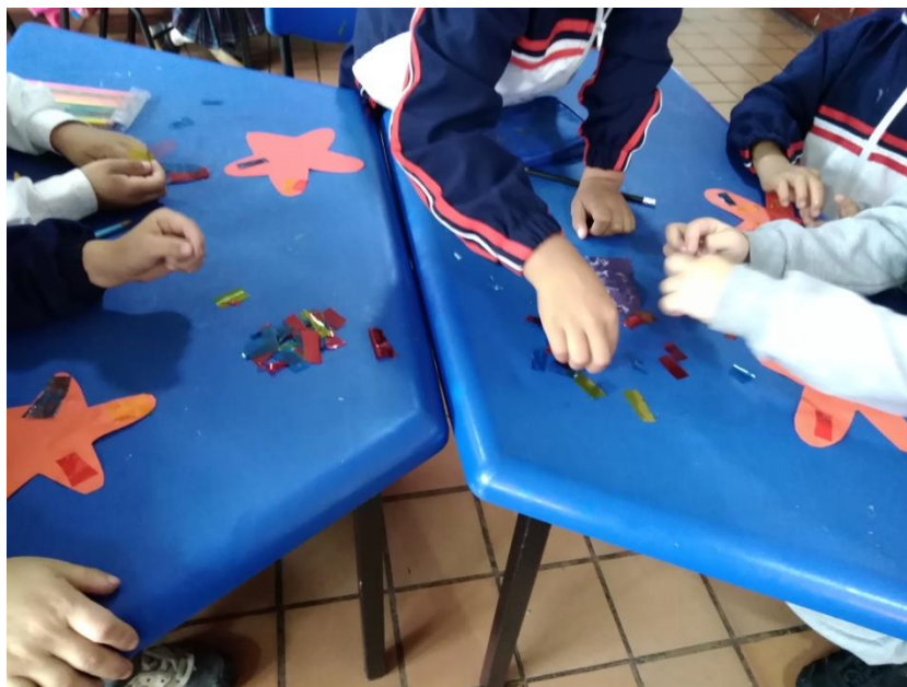
Figura 1143 Los estudiantes se encuentran realizando las estrellas y decorándolas. Elaboración propia.