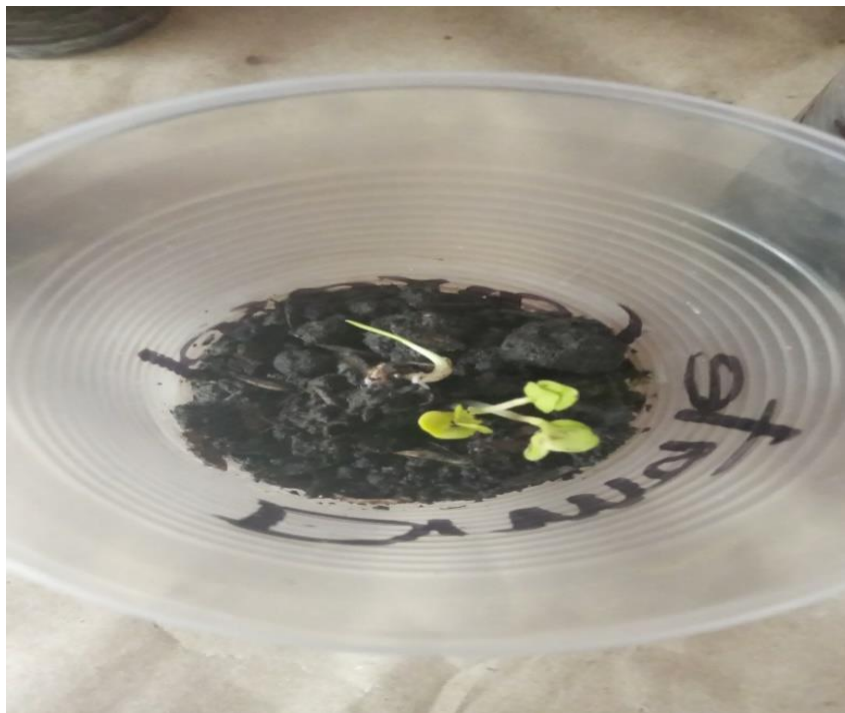
Figura 5 Observación del crecimiento y guía de las semillas de rábano. Elaboración propia