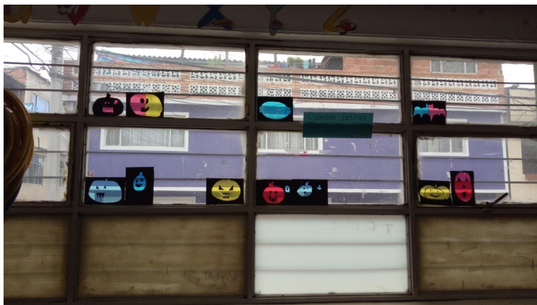
Figura 1042 Presentación de algunos de los dibujos presentados al ambiente de luz. Elaboración propia.