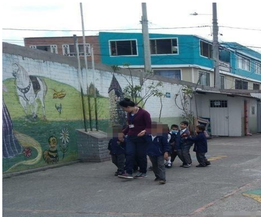
Figura 3 Desarrollo de la actividad, juego los cien pies guiada por las investigadoras. Elaboración propia.