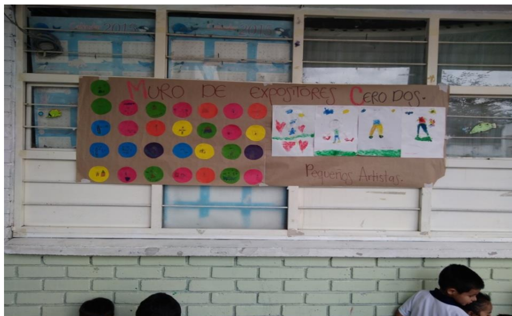
Figura 2123 Muro de expositores con actividades del día.