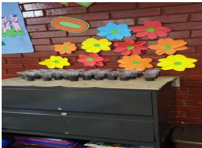
Figura 79 Taller de motricidad finalizado y exhibido por los estudiantes del grado cero. Elaboración propia.