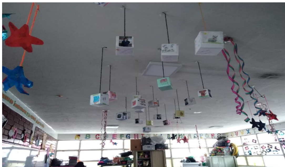
Figura 1648 Exposición de las cajas de la personalidad una vez finalizadas. Elaboración propia.