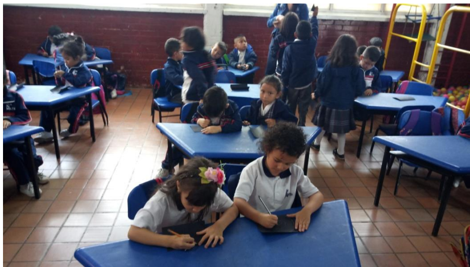
Figura 840 Los estudiantes se encuentran realizando el taller de luz con la guía de las instructoras. Elaboración propia

Los estudiantes de grado cero tienen la posibilidad de jugar con la luz natural, en un taller realizado con las investigadoras donde se les brinda las instrucciones de su realización y ellos se encargan de crear recortar y pegar su forma de arte.