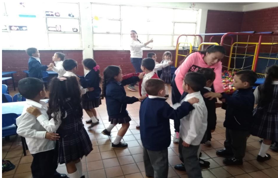
Figura 1924 Los niños de grado cero siguiendo las instrucciones de las investigadoras. Elaboración propia