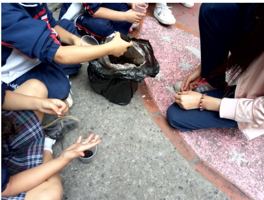
Figura 4 Presentación de los instrumentos para la actividad brindado por las investigadoras.