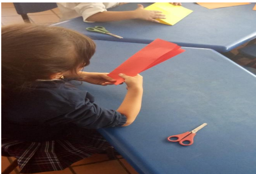
Figura 57. Los estudiantes se preparan para realizar la actividad según las instrucciones de la investigadora.

Una vez se dicen las instrucciones los estudiantes proceden a la realización de la misma, el investigador solo tiene el rol de observador y guía por lo tanto no debe intervenir en el proceso de construcción de conocimiento