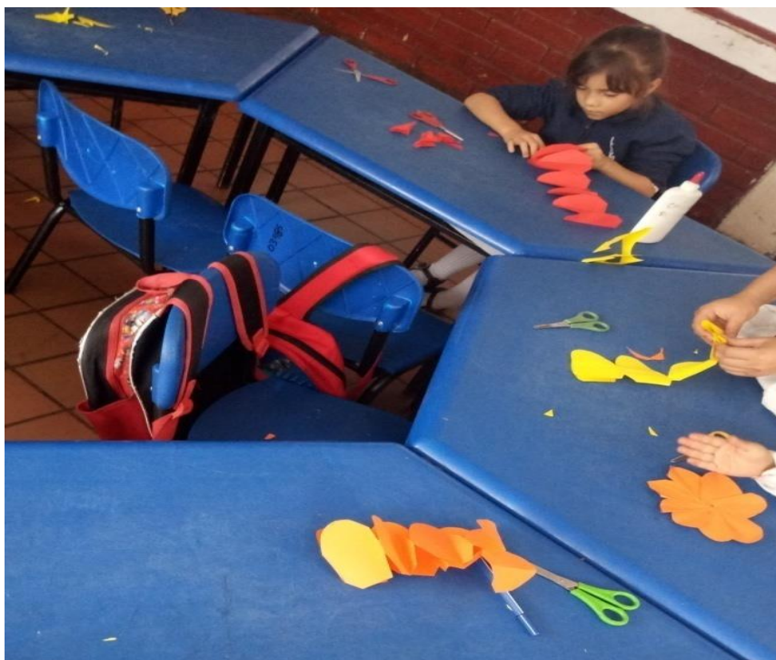
Figura 68 Estudiante del grado cero realizando de forma autónoma la actividad.