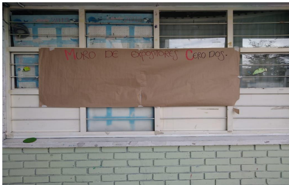
Figura 2022 Muro de expositores