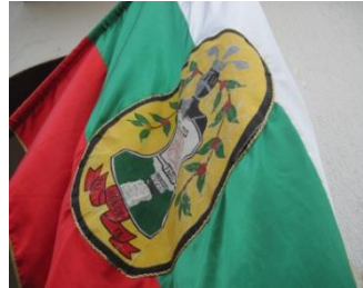
Bandera de Pandi Cundinamarca