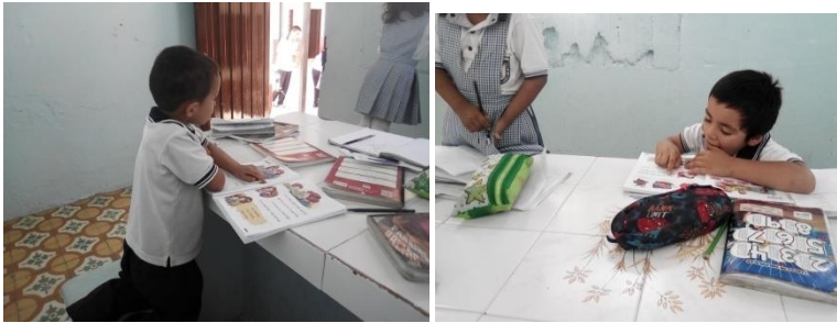
Anexo 5. Registro Fotográfico actividad: “Aprendizaje por medio del juego y dibujo”