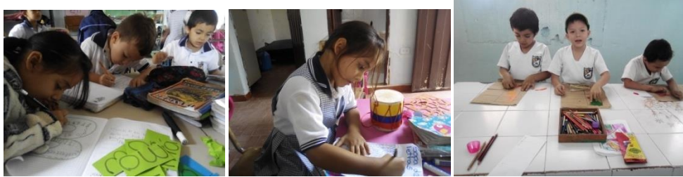
Anexo 8. Registro Fotográfico actividad: “ambiente en el aula de clase”