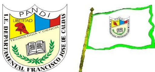
Bandera y escudo de la I.E.D Francisco José de caldas sede mercadillo