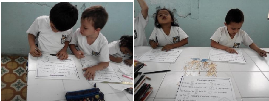
Anexo 4. Registro Fotográfico actividad: “Utilización de la cartilla Nacho”