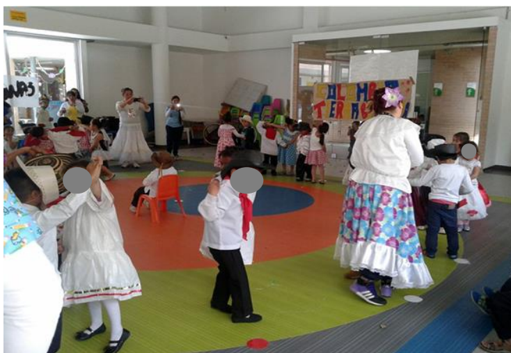
Imagen 7. Niños y niñas del nivel jardín E realizando baile típico de la región Andina.