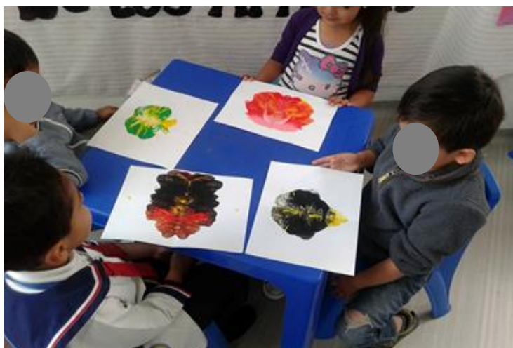
Imagen 5. Niños y niñas del nivel jardín E observando figuras abstractas.