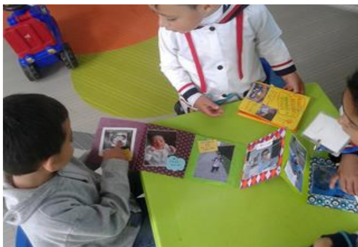
Imagen 10. Niños y niñas del nivel jardín E compartiendo las imágenes de su infancia.

para que el bebé se desarrolla normalmente. Este hecho evidenció la gran importancia de conocer y tener comunicación con el núcleo familiar de cada uno de los estudiantes, para que como docentes se comprenda el motivo de cualquier problema que tenga algún infante y entre docente - familia busquen herramientas que favorezcan el desarrollo integral del infante.