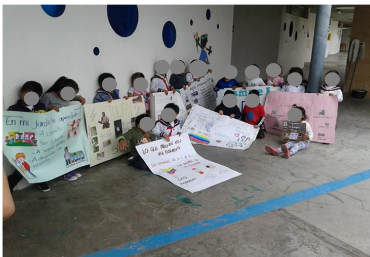
Imagen 9. Niños y niñas del nivel jardín E exponiendo los carteles que realizaron junto con sus familias.

Se considera que estos aprendizajes le permiten al niño lograr su independencia, es así que se resalta la importancia del trabajo en unión entre jardín, la comunidad educativa y la familia en la formación y superación personal para con el infante que presenta alguna limitación.