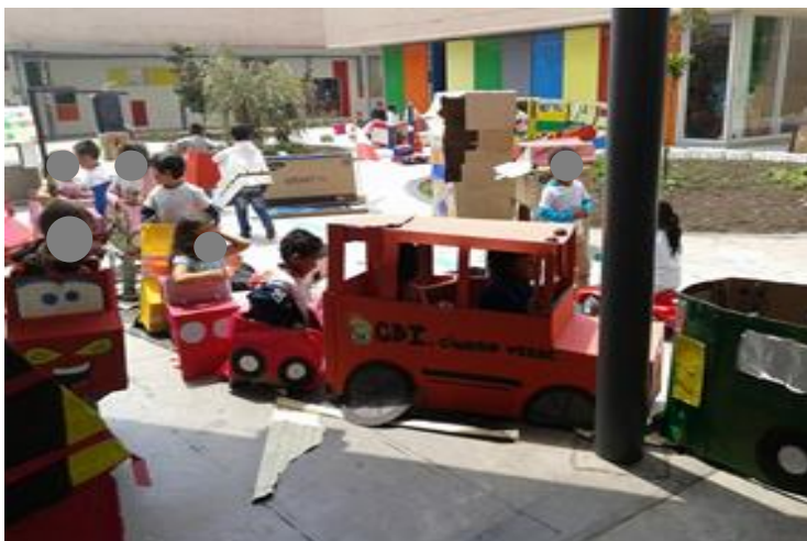
Imagen 8. Niños y niñas del nivel jardín E recorriendo el Centro de Desarrollo Infantil que estaba alusivo a la ciudad.