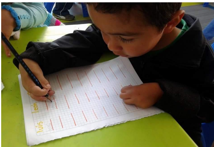
Imagen 6. Infante que presenta Artroriposis Congénita escribiendo su nombre.