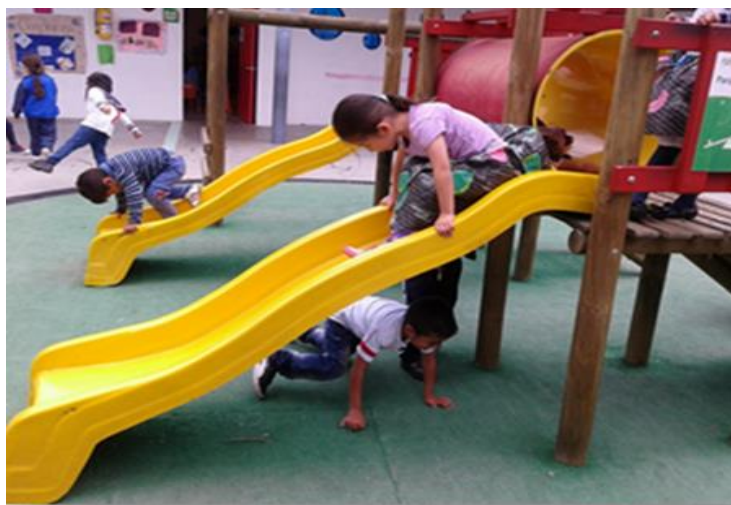
Imagen 4. Niños y niñas del nivel jardín E jugando en el parque.