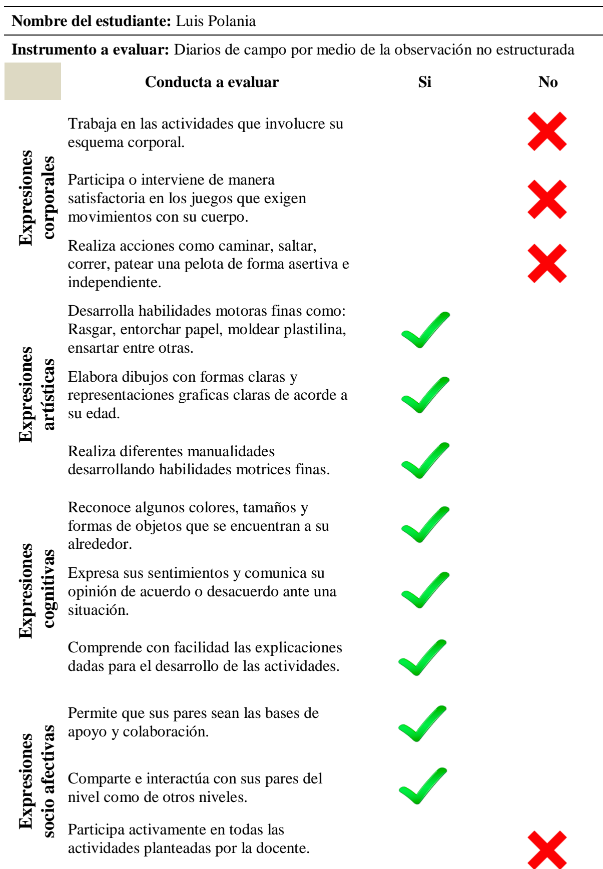
Tabla 2. Rejilla de evaluación hacia el estudiante.