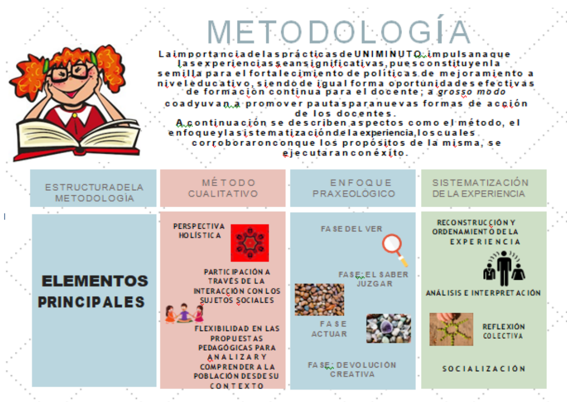
Tabla 1: Relación de la Sistematización de experiencias y el enfoque praxeológico