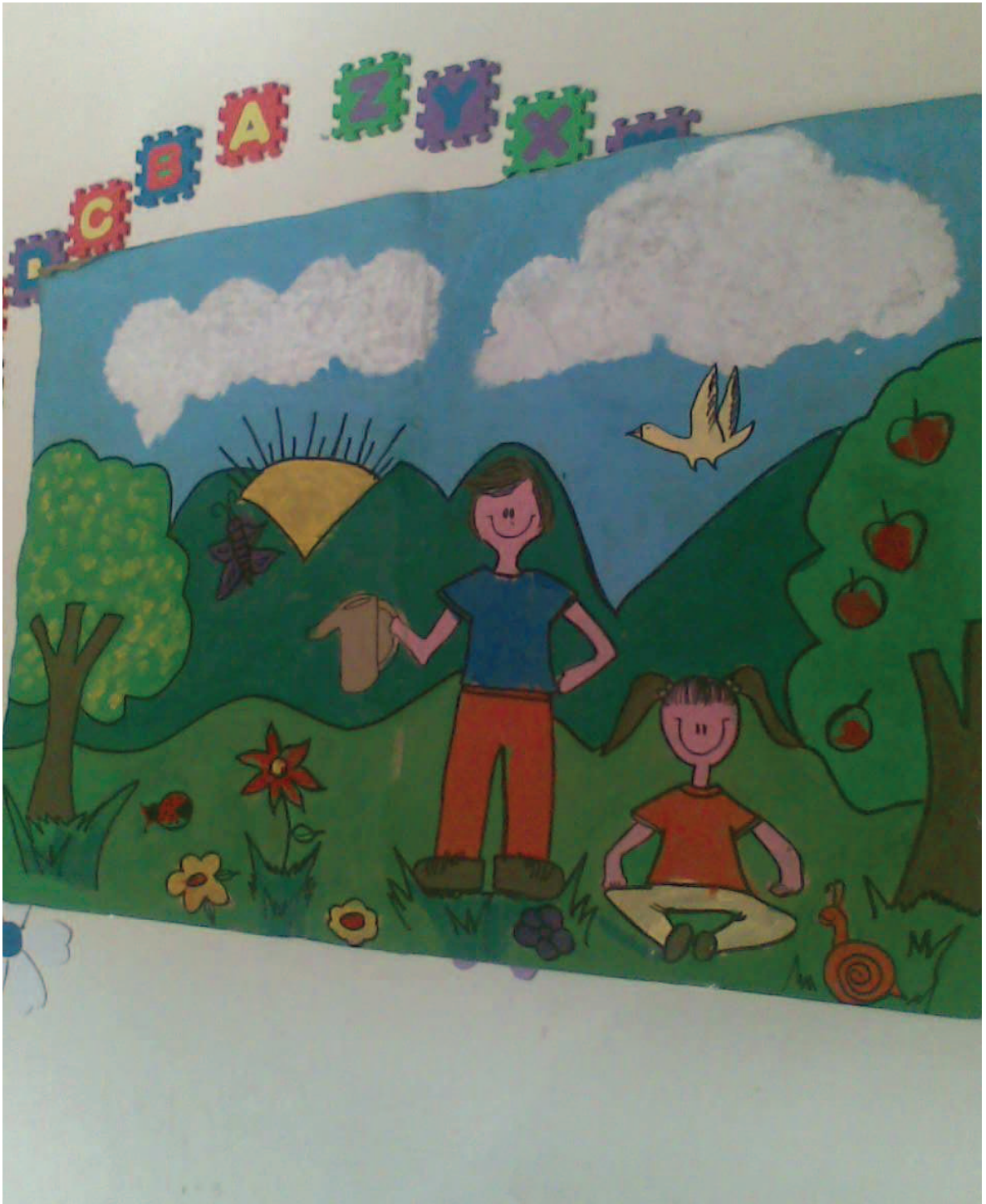
Trabajo de la naturaleza y yo Niños grado Transición Técnica: Pintura sobre kraff