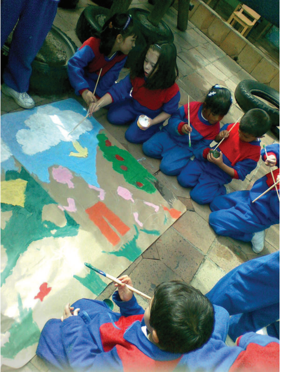
Grado Transición Trabajo La naturaleza y yo Octubre 27 de 2010