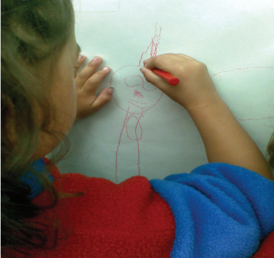
Grado Pre-Kínder Trabajo libre como motivación Marzo 8 de 2010