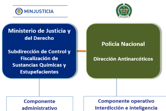
Figura 2 Entidades Competentes