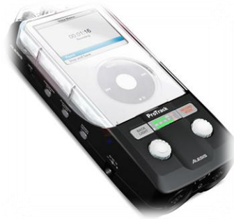
Grafico 3 grabación

Otro de los instrumentos usados en la recolección de datos fue la grabadora de audio, la cual permitió recolectar información detallada sobre las opiniones, preguntas, respuestas, debates que se generaron dentro del espacio académico en torno a la actividad planteada.