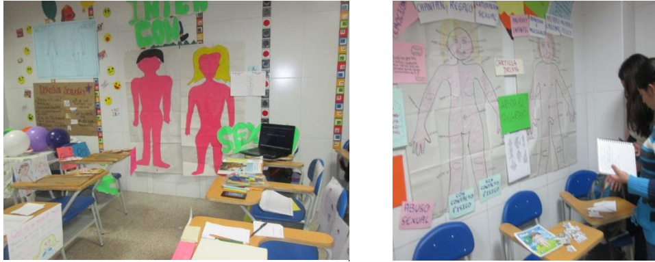
Grafico 1 rincón

Dentro del rincón de la actividad también se diseña una ficha de registro, en esta las participantes después de realizar una actividad implementada dentro del rincón debían dar respuesta a un interrogante, es decir que después de ellas haber construido su cuerpo en plastilina, respondían a una ficha de registro que les interrogaba sobre qué sintió al moldear el cuerpo, que le cambiaría?