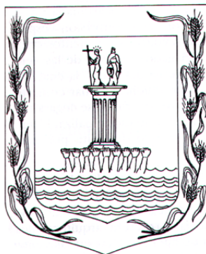
Figura 1. Escudo de Ubaté

Alcaldía Municipal de Ubaté, oficina de Planeación.