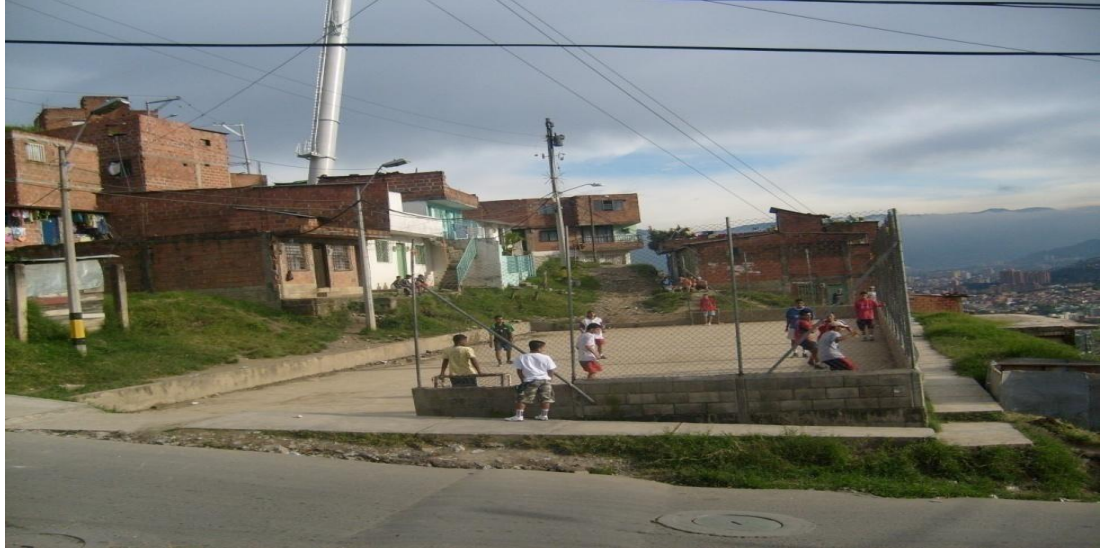
CANCHA LA DIVISA (antes de su transformación)