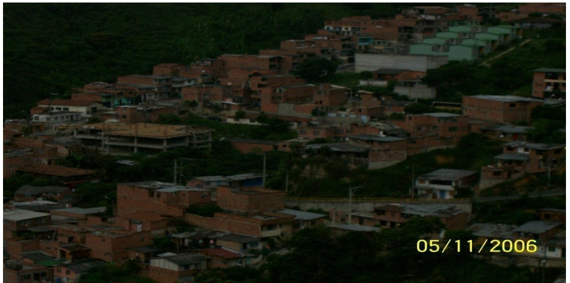
PARQUE LA DIVISA (antes de su transformación)

1. ¿A qué lugar corresponde esta fotografía?