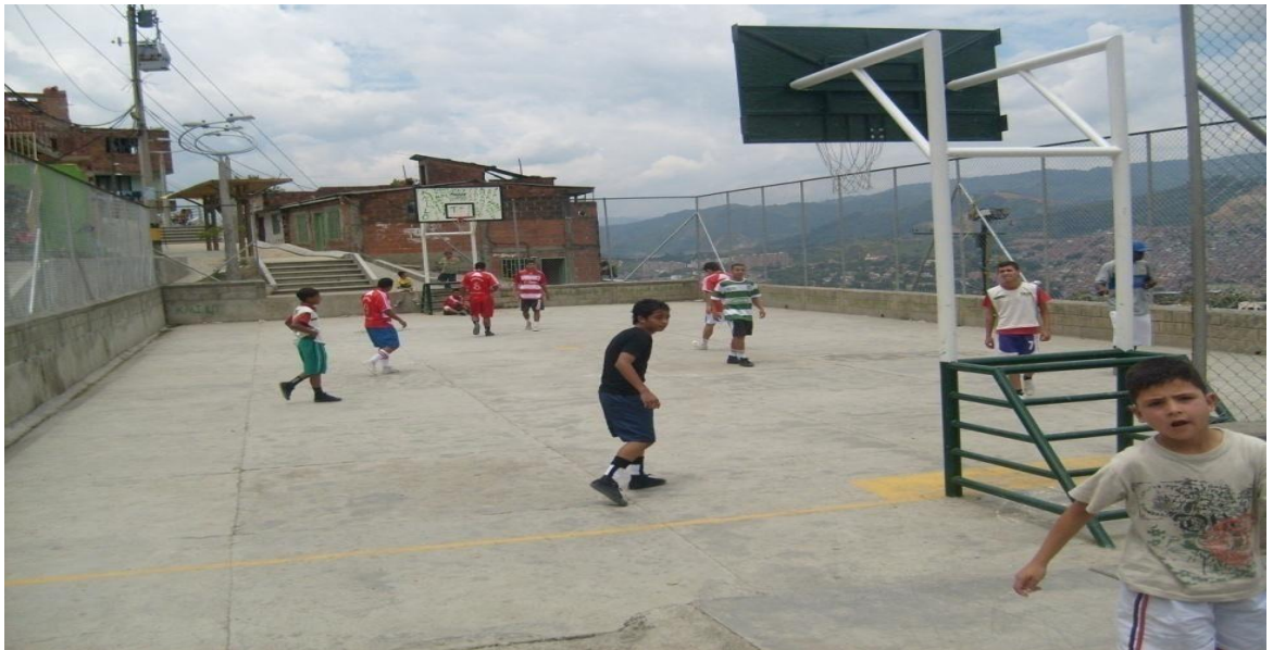
CANCHA LA DIVISA (después de su transformación)