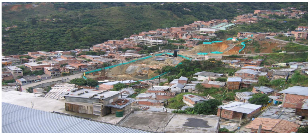
PARQUE LA DIVISA (en proceso de transformación)