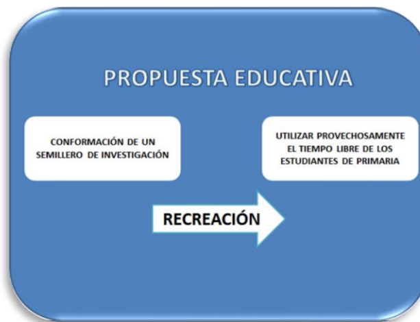
FIGURA N° 5

A partir de un proyecto transversal para el aprovechamiento del tiempo libre realizado en el área de Educación Física del Gimnasio Campestre la Sabana, se buscó incentivar un buen uso del tiempo libre en actividades de formación en recreación, entendiendo la importancia de crear una cultura en recreación que sirviera como soporte dinamizador de procesos educativos y de actividades que aportaron a la comunidad escolar. (FIG. 5)