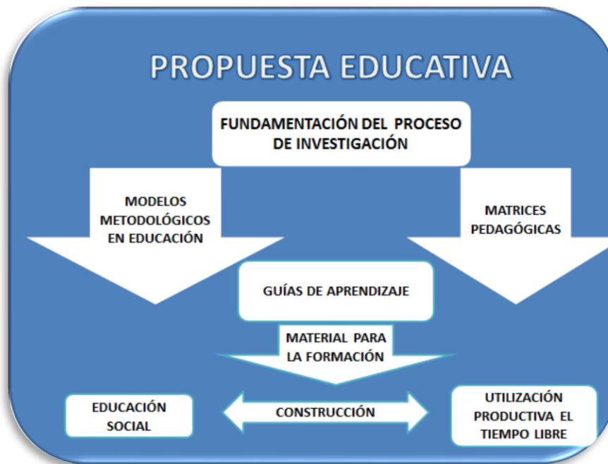
FIGURA N° 6

La formación de recreación y aptitud para el servicio social permitieron identificar nuevos líderes en los semilleros, que manejaran una buena comunicación y dominaran la motivación, esto les permitió canalizar la creatividad, donde no sólo ellos se divertieron y aprendieron, sino que aportan a la comunidad escolar en su desarrollo físico, intelectual, y emocional.