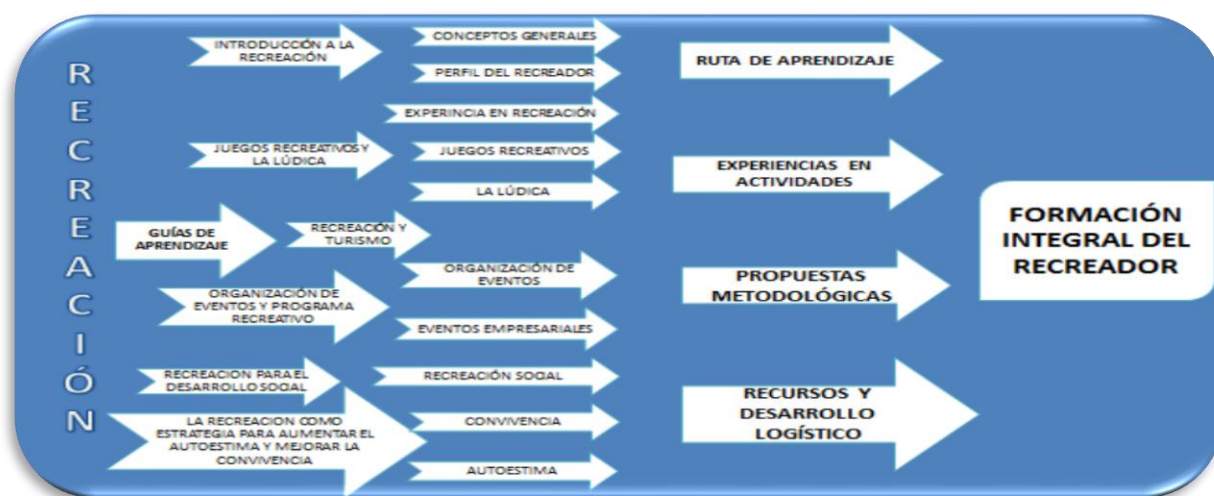
FIGURA N° 9

La sexta y última guía de aprendizaje, La Recreación como Estrategia para Aumentar el Autoestima y Mejorar la Convivencia , asumió la recreación como mediadora de procesos de desarrollo humano, y busco hacer de las prácticas recreativas procesos de aprendizaje y desarrollo cultural y como una herramienta para romper con los círculos de inactividad, violencia en las aulas y con los sentimientos de marginación y exclusión, los cuales a su vez se encuentran asociados a la pérdida de la autoestima. (FIG. 9)