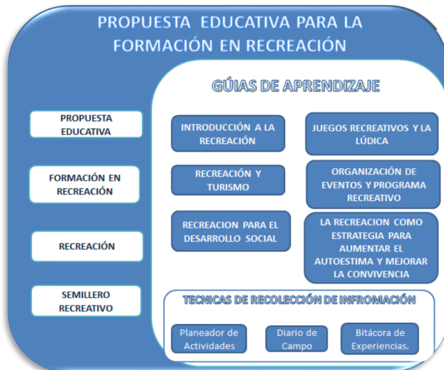
FIGURA N° 4

El presente análisis de resultados muestra lo acontecido con las categorías teóricas: Propuesta Educativa, Formación de Jóvenes, Recreación y Semillero Recreativo, a la luz de la práctica pedagógica desde el área de Educación Física, en donde se narrara el abordaje desde las guías de aprendizaje: Introducción a la recreación, Juegos Recreativos y la Lúdica, Recreación y Turismo, Organización de Eventos y Programas Recreativos, Recreación para el Desarrollo Social y Recreación como Estrategia para Aumentar la Autoestima y Mejorar la Convivencia, utilizando como instrumento de recolección de información , El Planeador de Actividades (Organizador de sesiones, metodologías, recursos y evaluación del docente), el Diario de Campo (Recurso de narración de la práctica docente) y la Bitácora de Experiencias (Reconstrucción de experiencia conceptual y práctica del estudiante del semillero) . (FIG. 4)