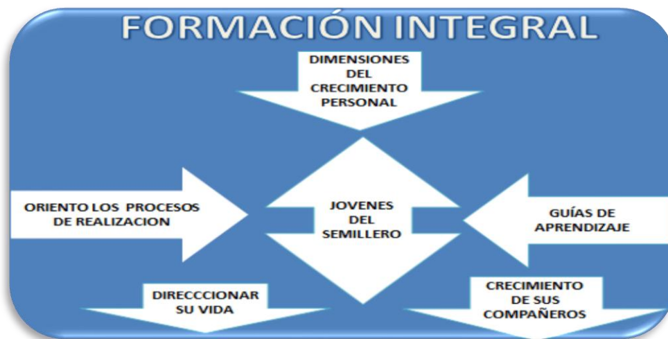
FIGURA N° 8

En su dimensión sociopolítica, se dio al estudiante del semillero la capacidad para vivir “entre” y “con” otros, de tal manera que puede transformarse y transformar el entorno socio cultural en el que está inmerso. Se formó como ciudadano a partir de su conciencia histórica que parte de la formación social y política de su entorno. La formación en valores cívicos que comprende el sentido de lo público, la solidaridad, la justicia, y el reconocimiento de la diferencia. La formación de un pensamiento (juicio) y de una acción políticas que tienen que ver con la palabra, los discursos, las razones y las personas. Se relacionan con los demás y discuten acerca de los asuntos comunes.