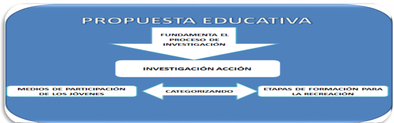
FIGURA N° 7

La articulación de los procesos se realizó a partir de las didácticas empleadas (guías de aprendizaje) determinando que el semillero en recreación tenga como propósito principal crear, organizar y poner en funcionamiento un recurso metodológico en el área recreativa, el cual se constituirá en una fuente básica de aprendizaje y aportará al comportamiento lúdico, en el crecimiento y desarrollo de los niños de primaria de esta institución. (FIG. 7)