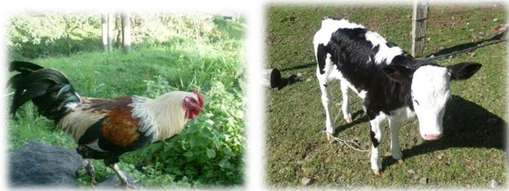
Fotografía 2 y 3: Algunos de los animales presentes en la finca: