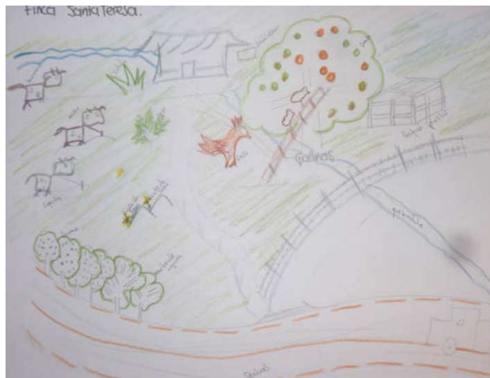
Mapa 1. Cartografía Familia Reyna

En el mapa se puede identificar la ubicación de la finca, esta queda ubicada al borde de la carretera nacional que conduce de Bogotá a Guaduas (vía antigua), es un terreno semi montañoso, húmedo. La casa está construida en bareque , tiene servicio de luz pero no de agua ya que tienen una quebrada que pasa por la finca, en la parte alta de la finca está la casa y el galpón de las aves, los bovinos permanecen cerca a la casa en una parte cuya inclinación es mínima. Hay un jardín y una pequeña huerta en la cual se encuentran plantas como el apio, la caléndula, amapola, cilantro, entre otras; por otra parte la finca cuenta con una cerca viva compuesta por arboles de Madre de Agua y Sauco. Hace presencia también un árbol de Limón de alto porte ubicado cerca de la casa, en el cual permanecen un gallo y dos gallinas piropas (estas gallinas en el momento de la entrevista no estaban poniendo).